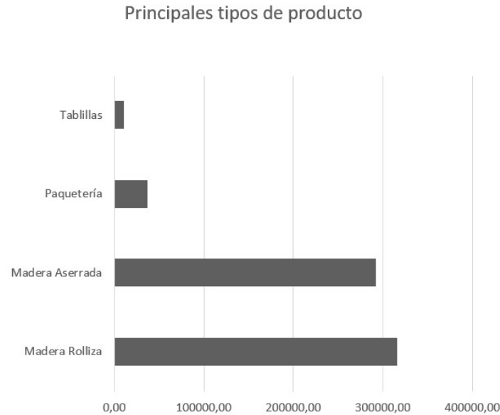
Figura 2. Producción forestal maderable (m³) del Perú en el año 2021 (SERFOR, 2022). Figure 2. Peru’s timber forest production (m³) in 2021 (SERFOR, 2022).

Ahora bien, lo que se llama aquí producción forestal es en realidad extracción. Alude a la apropiación del trabajo de la naturaleza e incluso del trabajo humano que no siempre es compensando de acuerdo al trabajo realizado. Como señala Toledo (2008), como se citó en Arístide (2013):