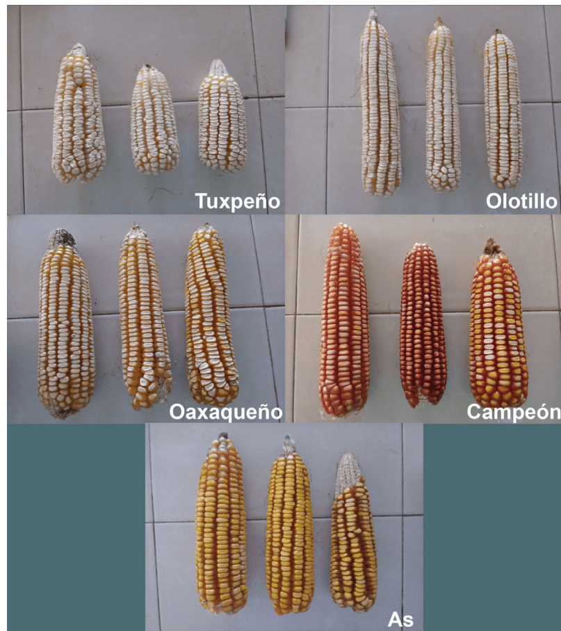
Figura 2. Maíces nativos evaluados. Figure 2. Native maize evaluated.