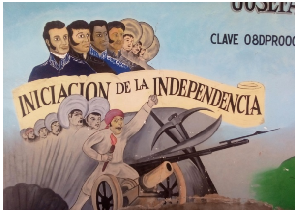
Imagen 8. Mural 2. Detalle de la escena 1.

En el lado derecho, la segunda escena es más reconocida, siendo la tradicional representación del Grito de Dolores, imagen insigne del movimiento de Independencia. Miguel Hidalgo se presenta al centro, arengando a los pueblerinos con el estandarte de la Virgen de Guadalupe en una mano y también el puño al aire, como imagen espejo con la escena de la izquierda. Inclusive todos los personajes tienen el puño levantado, en alusión a la rebelión. También se observa un pergamino frente a la muchedumbre, superpuesto y con la frase Abolición de Esclavitud escrita en él, y unas cadenas rotas. Este último simbolismo también es usado con frecuencia en el arte, representando la liberación de las personas oprimidas (ver imagen 9).