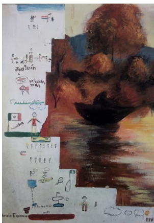
Imagen 4. Mural 1. Detalle de las pinturas anexas de los alumnos.

Como se observa en esta primera aproximación al muralismo institucional a nivel primaria, el valor de la figura histórica como tal ofrece elementos de solemnidad que algunos planteles educativos buscan como valores a transmitir. Como ejemplo se aprecia el texto dedicado a Guadalupe Victoria con el que las autoras rematan su obra, y donde apuntalan la etiqueta que lleva una obra de estas características (ver imagen 5).