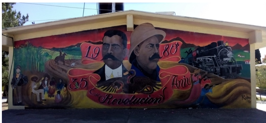
Imagen 10. Mural 3. 35to Aniversario de la Escuela Revolución. Autor: Jorge Rubio.

Lo primero que resalta en esta pintura es el cintillo que manifiesta que fue elaborado expresamente para el 35to aniversario de la escuela en cuestión, la cual fue fundada en 1980, como se lee en un principio. Se corrobora el dato de la celebración con el año de elaboración, 2015, inscrito junto a la firma del artista (ver imagen 11).