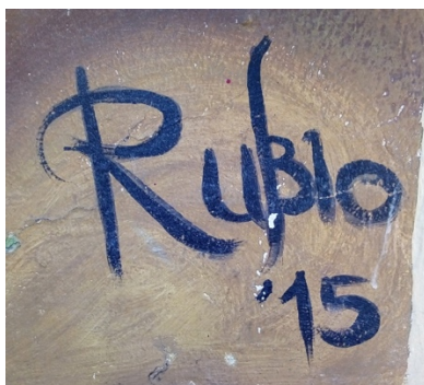
Imagen 11. Mural 3. Detalle de la firma del autor.

Lo primero que resalta en esta pintura es el cintillo que manifiesta que fue elaborado expresamente para el 35to aniversario de la escuela en cuestión, la cual fue fundada en 1980, como se lee en un principio. Se corrobora el dato de la celebración con el año de elaboración, 2015, inscrito junto a la firma del artista (ver imagen 11).