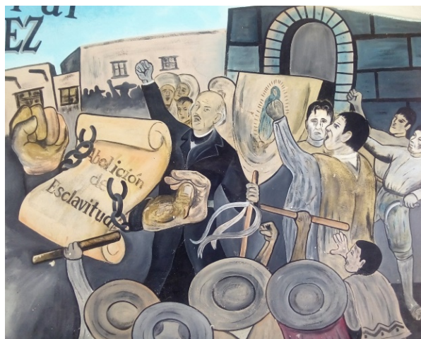
Imagen 9. Mural 2. Detalle de la escena 2.

Tanto la figura central como las escenas de los lados están acogidas en un fondo completamente azul, el de un cielo sin nubes que lo cubran, ni contratiempos que frenen la lucha independentista iniciada. Es de tomar en cuenta la combatividad reflejada en este mural. Es probablemente la combatividad que quiso ser transmitida hacia los niños como esencia de los héroes de Independencia.