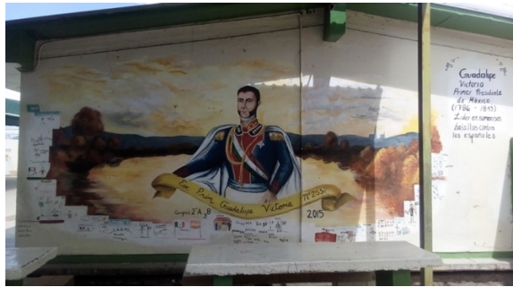
Imagen 1. Mural 1. Guadalupe Victoria. Autoras: Esparza, García, Perea y Ruiz. Fotografía: Adán Erubiel Liddiard.

En este primer acercamiento al mural con figura histórica se pueden encontrar algunas características mencionadas anteriormente, como que se sitúa justo detrás del portón de reja de entrada, pudiendo ser visto desde el exterior y siendo el primer referente visual al ingresar a la escuela. En él se representa al primer presidente del México independiente, Guadalupe Victoria, en actitud solemne pero serena, sin rasgos beligerantes ni impulsivos (ver imagen 2). Contiene la tranquilidad que pudiera desearse del primer gobernante de una nueva nación. Sin embargo ostenta una mirada fija y decidida, observante de la llegada de los niños por el portón de entrada cada mañana desde 2015, cuando fue pintado.