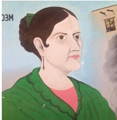
Imagen 7. Mural 2. Detalle de la figura histórica.

imagen 7). Se crea así un notorio paralelismo entre la persona y el concepto de nación, apelando incluso a lo subliminal.