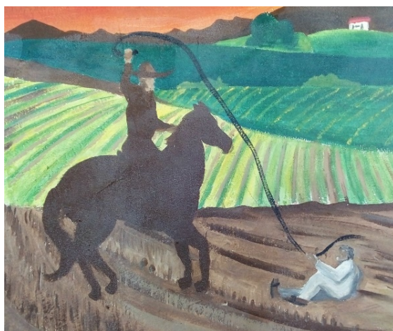
Imagen 13. Mural 3. Detalle de la escena 1.

narrativas, ahora revolucionarias, situadas a los lados de la estampa central. Se analizarán sólo un par por cuestión de espacio. La primera hace referencia a la desigualdad social y atropellos que se vivían en la época, con una representación cruda de un hacendado a caballo lacerando con un látigo a un campesino ya sometido y tirado en las líneas de arado (ver imagen 13).