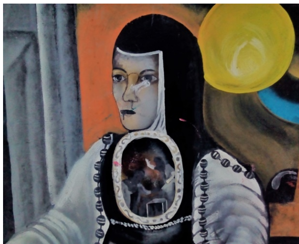
Imagen 19. Mural 5. Detalle de la figura histórica.