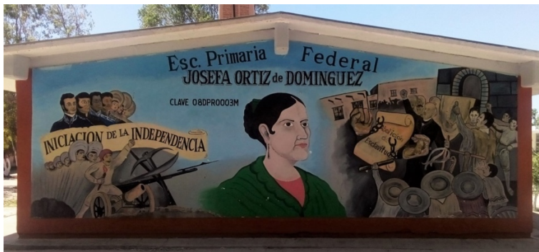
Imagen 6. Mural 2. Josefa Ortiz de Domínguez. Autor: Desconocido.

Josefa Ortiz de Domínguez, ubicada en la calle Emiliano Zapata s/n, de la colonia Villa Juárez (ver imagen 6).