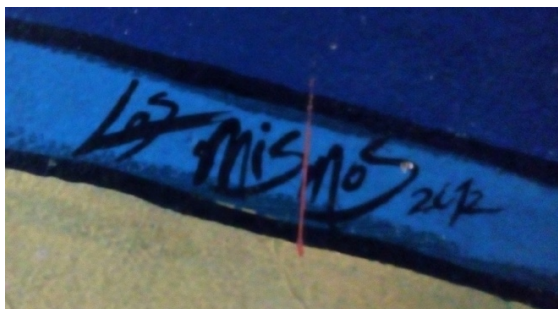
Imagen 17. Mural 4. Detalle de la firma de los autores.

Se puede apreciar que la estética de estas pinturas es distinta a la de las anteriormente presentadas. Mientras que en aquellas la solemnidad y el discurso visual de estampa escolar era innegable, en estas se distingue un concepto distinto en los elementos que rodean las efigies de los personajes. Es libre, artístico y fluido en todas direcciones. Se contempla geométrico y orgánico por las diversas figuras circulares usadas. Incluso onírico por como resalta la mano, pero deja en la figura humana ese pequeño remanso de respeto a lo clásico. Este giro creativo, avalado por los directivos en turno, se presenta ya que el autor es miembro de un colectivo llamado Los Mismos, con obras murales del tipo urbano a lo largo de la ciudad de Chihuahua, caracterizadas, además por su alta calidad técnica, por su frescura en cuanto a propuesta (ver imagen 17).