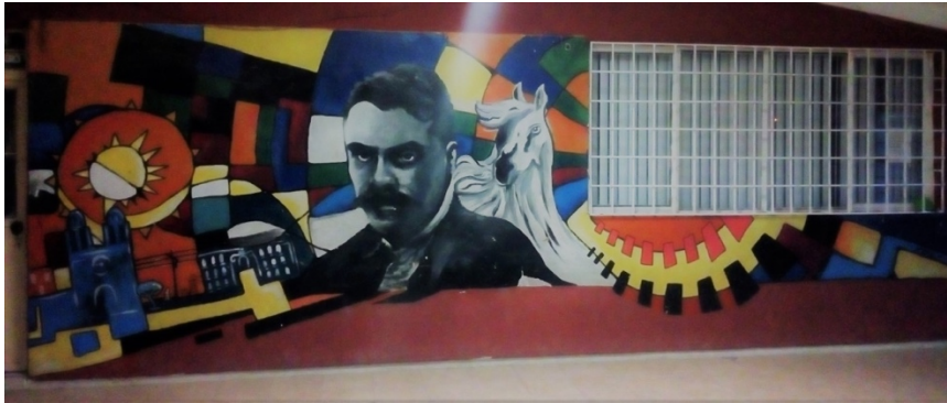
Imagen 15. Mural 4. Emiliano Zapata. Autores: Colectivo Los Mismos.

Cruz, ambos dentro de la Escuela Primaria Emiliano Zapata, ubicada en la calle Francisco I. Madero #101, de la colonia Villa Juárez (ver imágenes 15 y 16).