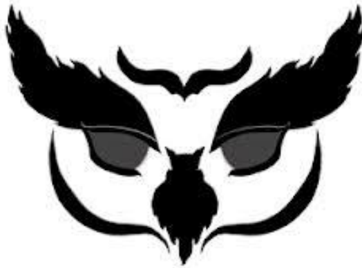
Imagen moderna inspirada en el búho utilizada en la Facultad de Filosofía y Letras