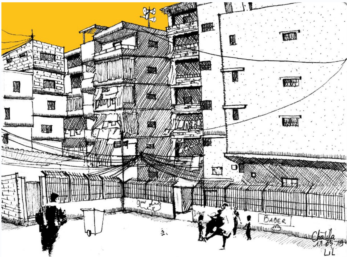
Figure 3: Lilia Benbelaïd. Cour . 2019, encre, canson, 19 x 14 cm, camp de Chatila, Beyrouth.