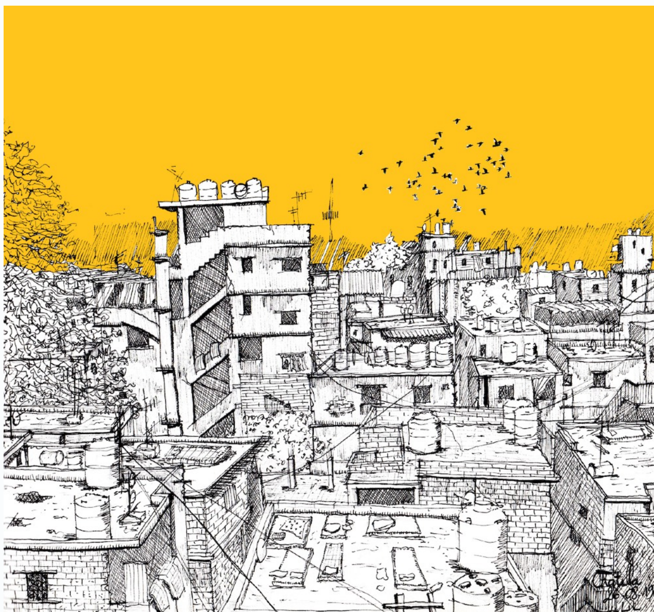
Figure 2: Lilia Benbelaid. Toits . 2019, image digitale, encre, canson, 22 x 19 cm, Chatila, Beyrouth.