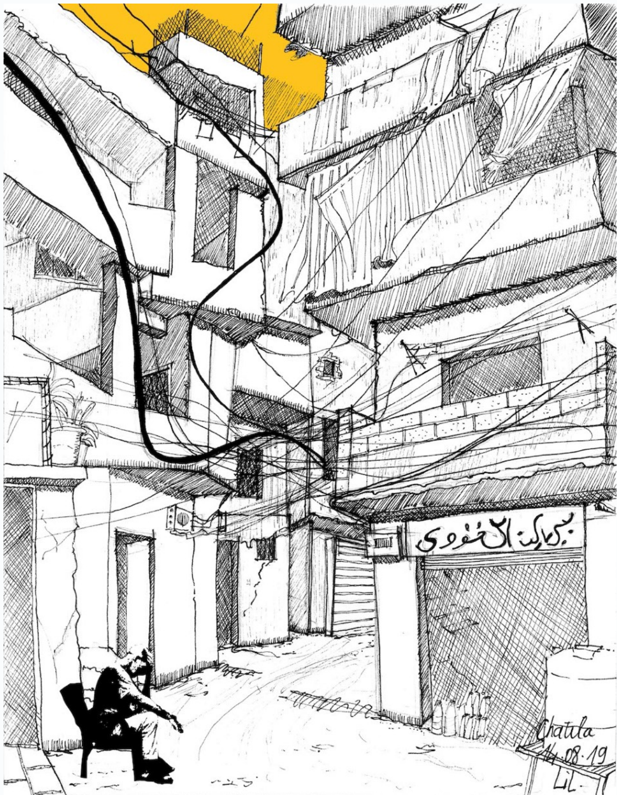
Figure 1: Lilia Benbelaid. Rue . 2019, image digitale, encre, canson, 22 x 19 cm, Chatila, Beyrouth.