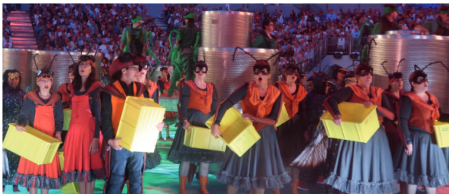
Figure 2 fourmis choristes D. Vinck

La fabrique du son résulte aussi de compromis liés à la scénographie. Ainsi, la coexistence de deux sources sonores incompatibles – le vrombissement de ventilateurs qui gonflent une grande bache pendant que joue une flûte de pan – conduit à modifier la sonorisation et à neutraliser un des bruits (Rot 2020), tandis que le placement des chœurs, testé dans l’arène par le metteur en scène, confirme le mauvais résultat prévu par les simulations et conduit à revoir la mise en scène. La sonorisation dépend aussi des costumes, imprévus au moment des simulations. Ainsi, le jour où les choristes répètent costumés, les sondeur·ère·s découvrent que si les bérêts ne gênent pas les micros fixés sur le front pour assurer un bon angle pour la captation, les casques des fourmis (choristespercussionnistes) posent problème (figure 2), ce qui conduit les costumières à concevoir, tester et fabriquer des serretêtes. Costume et captation sont réajustés l’un à l’autre. L’apparence visuelle et le son entrent également en tension avec la sonorisation des cors des Alpes. Le metteur en scène refusant les micros posés sur scène, les sondeur·ère·s reconçoivent l’équipement et fixent des micros sur les instruments, mais, ne disposant plus de micros sansfil, les musicien·ne·s doivent s’adapter et emmener avec eux câbles, micro et cor lorsqu’ils entrent et sortent de scène.