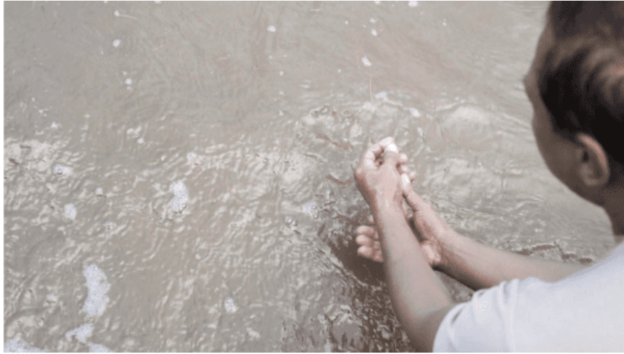
photogrammes 10 et 11