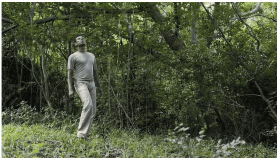
photogrammes 5, 6 et 7