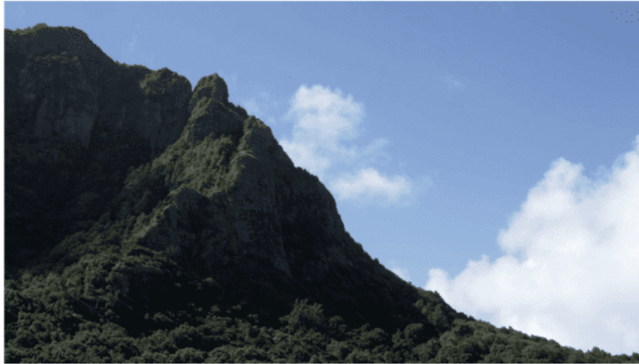
photogrammes 3 et 4