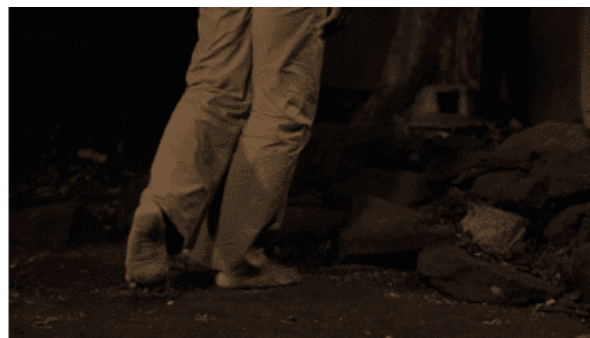
photogrammes 14 et 15