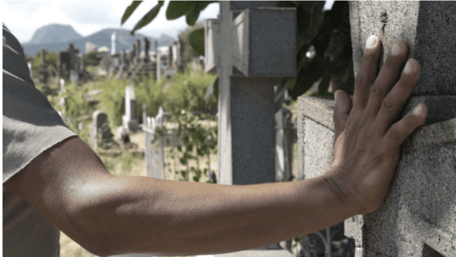
photogrammes 8 et 9