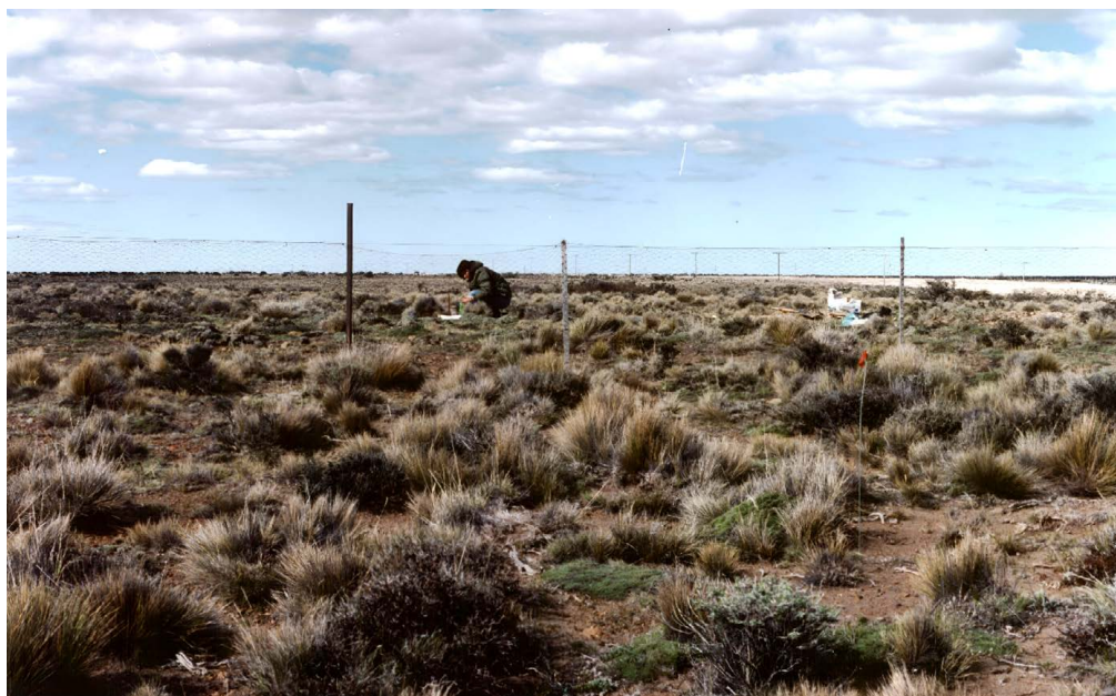
Figura 2. Clausura en Pampa Salamanca para el desarrollo de las investigaciones en productividad. Figure 2. Closure in Pampa Salamanca for the development of research on productivity.

A comienzos de los años 2000, Miguel se sumergió en el estudio de la productividad primaria neta y forrajera en relación con los espectros biológicos presentes en los diferentes ambientes de la estepa patagónica (Figura 2). Fue así como, a partir de muestreos estacionales de biomasa aérea, durante varios años y en diferentes sitios de la estepa patagónica, sus resultados, publicados en Bertolami et al. (2008), muestran la vinculación entre los biotipos y la biomasa, sus implicaciones ecológicas y, consecuentemente, el potencial uso ganadero que puede tener este abordaje en ambientes altamente condicionados por el clima; los biotipos se definen como agrupaciones de plantas según sus similitudes estructurales y funcionales (Mueller-Dombois y Ellenberg, 1974). Cabe destacar que varios autores retomaron después este análisis, iniciado por Miguel.