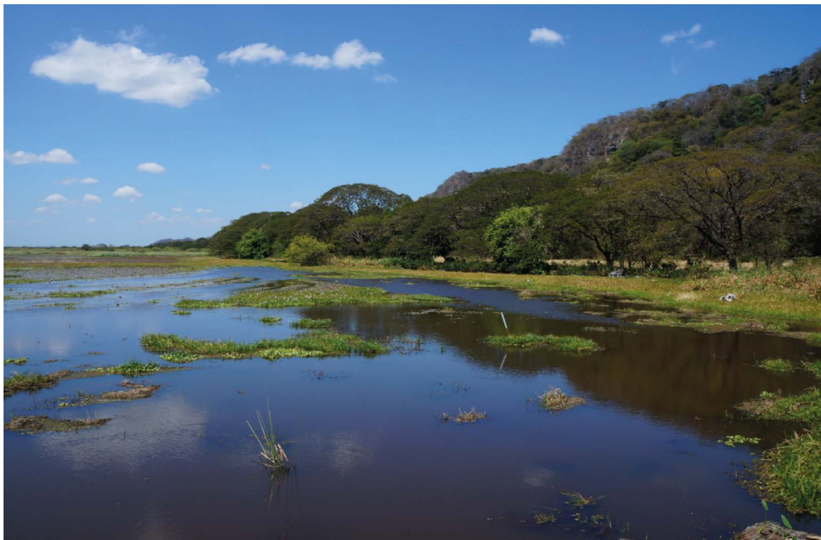
Figura 3. Humedal palustre de tierras bajas, en el Parque Nacional Palo Verde, en Guanacaste, Costa Rica. Figure 3. Lowland palustrine wetland, in Palo Verde National Park, in Guanacaste, Costa Rica.