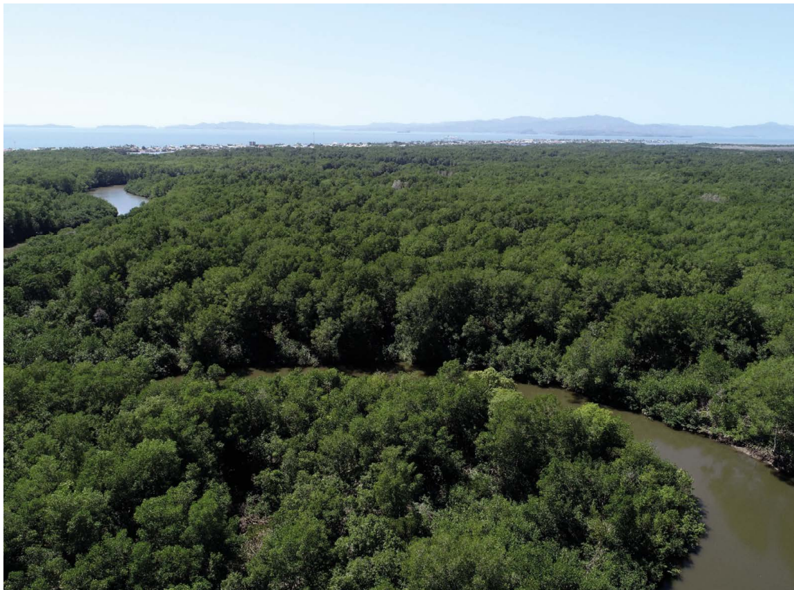
Figura 2. Humedal marino-costero, representado por un manglar, en el golfo de Nicoya, Costa Rica. Figure 2. Marine-coastal wetland, represented by a mangrove, in the Gulf of Nicoya, Costa Rica.

Dado que la mayoría de los humedales inventariados en el país pertenecen a la categoría palustre (77.36 %), se evidencia la relevancia de los pantanos en el nivel nacional, a pesar de haber sido históricamente invisibilizados en las políticas y estrategias de conservación. Estos humedales predominan en áreas inferiores a 2 000 metros de altitud, aunque también existen pantanos de altura, generalmente, de menor extensión, como las turberas, ubicadas entre 2000 y 3000 metros, así como las lagunas estacionales del piso altitudinal subalpino (SINAC-PNUD-GEF, 2018).