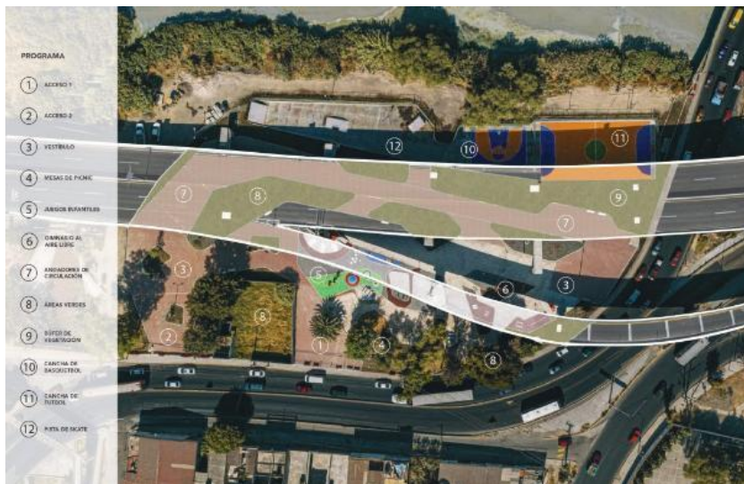
Figura 6. Vista Planta del proyecto arquitectónico del Parque El Dique diseñado por Taller de Urbanismo Mx.