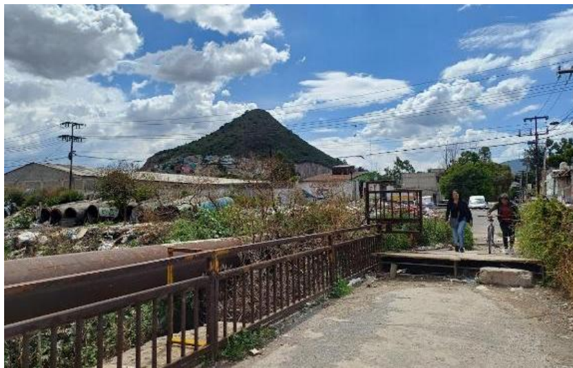
Figura 3. Mujeres de la colonia Prados de Santa Clara en uno de los puentes del Gran Canal

La fotografía fue tomada en el cruce cotidiano de las y los habitantes de dos colonias colindantes al Gran Canal: Prados de Santa Clara y Jardines de Casanueva. Puede observarse al fondo una bodega industrial abandonada, así como otros residuos de construcción y domésticos que suelen ser depositados en las orillas del canal.