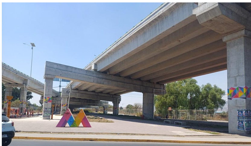
Figura 5. Parque El Dique a cuatro años de su inauguración