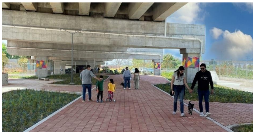
Figura 4. Imagen conceptual del proyecto arquitectónico de Parque El Dique.

Esta imagen conceptual muestra la distribución espacial y los elementos arquitectónicos del Parque El Dique, diseñado por Taller de Urbanismo MX como parte de una estrategia de regeneración urbana en Ecatepec.