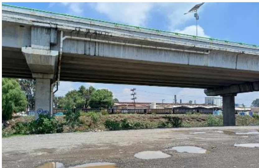
Figura 2. Zona Industrial de Santa Clara a la orilla del Gran Canal, colonia el Charco

El Gran Canal en su paso por la colonia El Charco, donde puede apreciarse al fondo, uno de los parques industriales de Ecatepec que sigue operando y el paso del ferrocarril de transporte de mercancías que en el momento de la captura de la fotografía ocultó los hogares informales que hay en las orillas del canal. Por encima de éste se puede ver la autopista urbana Siervo de la Nación, inaugurada en 2019.