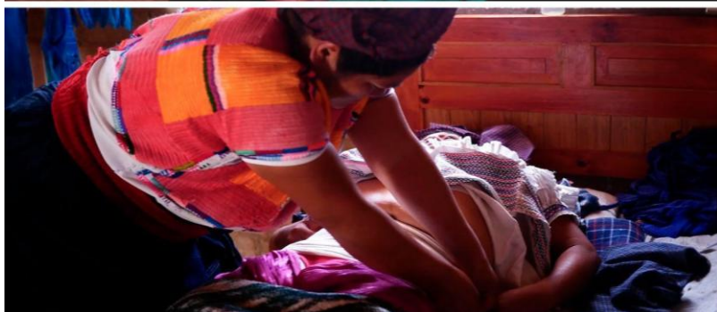
Fotogramas del documental Caridad-Itam Aja de Diana Álvarez y Litay Ortega