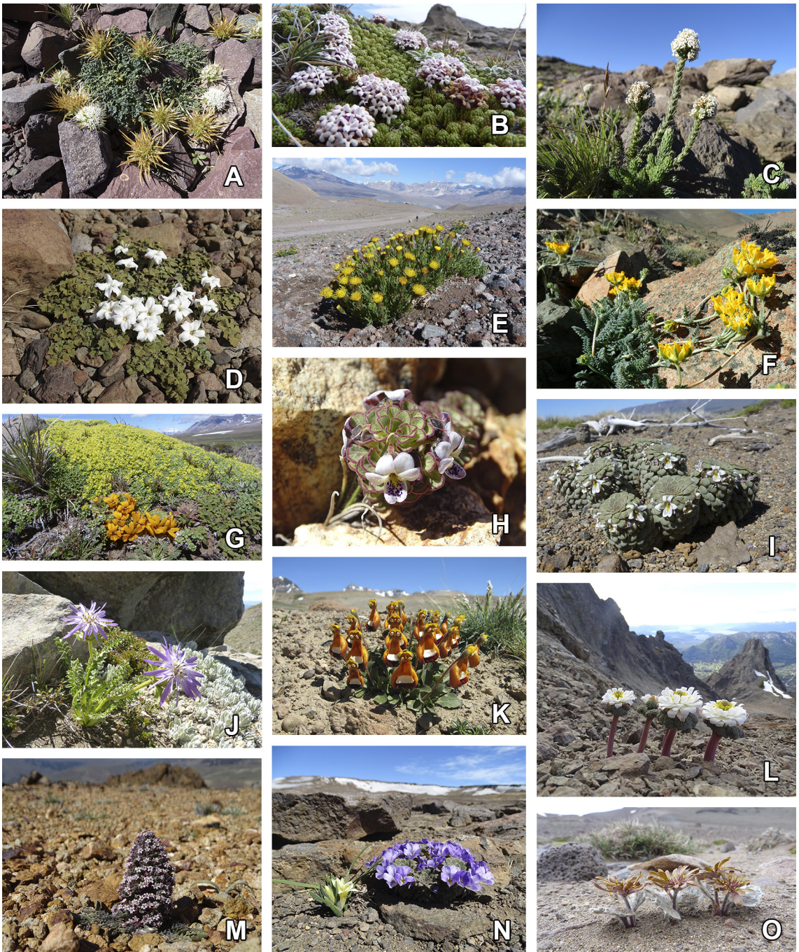
Fig. 3. Ejemplos de especies de alta montaña en la Patagonia argentina. A , Leucocera horrida . B , Junellia congesta . C , Nassauvia digitata . D , Jaborosa volckmanii . E , Senecio tricefalus . F , Pinnasa incurva . G , Azorella valentini y Viola auricolor . H , Viola anitae . I , Viola pachysoma . J , Perezia lyrata . K , Calceolaria uniflora . L , Callianthemoides semiverticillata . M , Valeriana moyanoi . N , Olsynium frigidum y Viola cotyledon . O , Hamadryas kingii . Figura en color en la versión en línea http://www.ojs.darwin.edu.ar/index.php/darwiniana/article/view/1072/1284