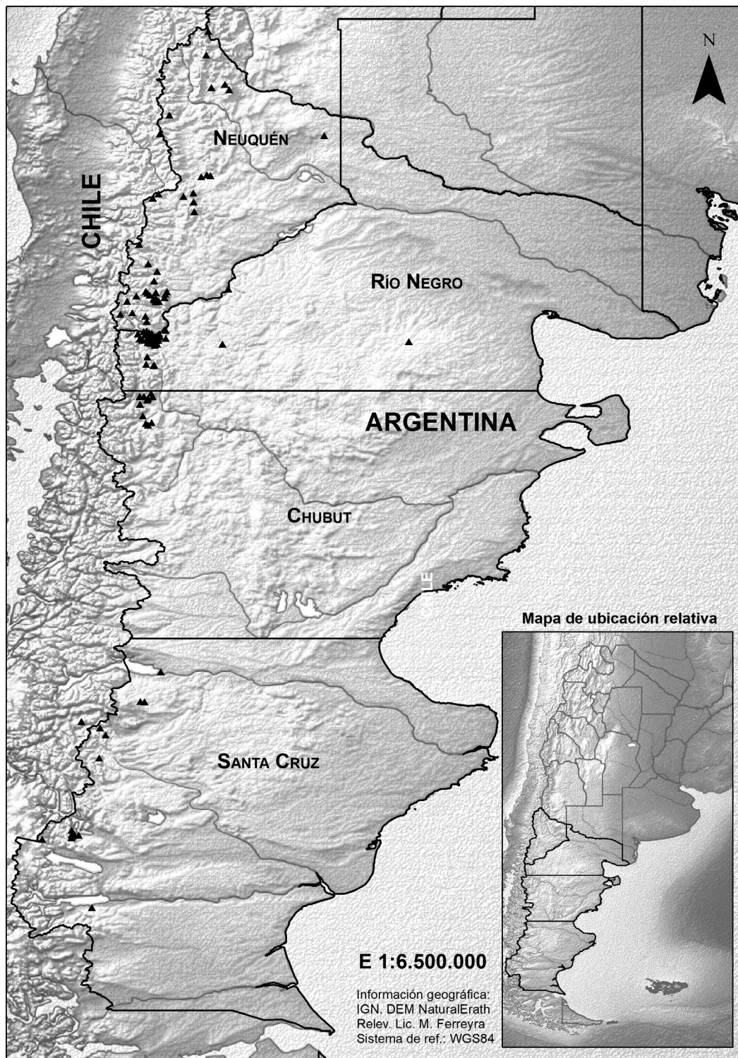
Fig 1. Cerros relevados en las 4 provincias argentinas de la Patagonia continental. Los nombres y coordenadas de cada cerro por provincia en el Apéndice 1.