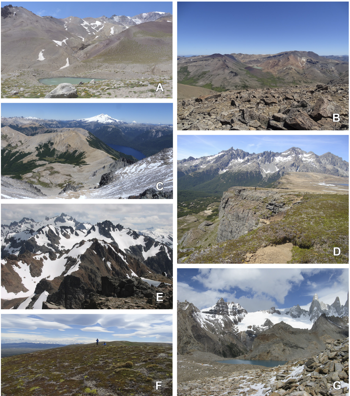
Fig. 2. Ejemplos de paisajes de cerros relevados. A , ANP Domuyo, ascenso al Volcán Domuyo. B , Cerros Oeste Zapala, vista desde el cerro Palau Mahuida. C , PN Nahuel Huapi, vista desde el cerro López. D , ANP Río Turbio, cerro Plataforma. E , PN Lago Puelo, vista desde el cerro Cuevas. F , Filo en Estancia Stag River. G , PN Los Glaciares, vista desde el cerro Madsen. Figura en color en la versión en línea http://www.ojs.darwin.edu.ar/index.php/darwiniana/article/view/1072/1284

Estos son: zonas muy húmedas como mallines o vegas y bordes de cursos de agua a cualquier