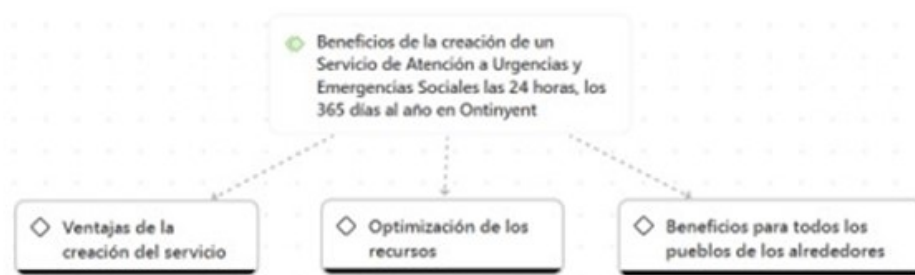
Figura 7. Beneficios de la creación de un Servicio de Atención a Urgencias y Emergencias Sociales las 24 horas, los 365 días al año en Ontinyent