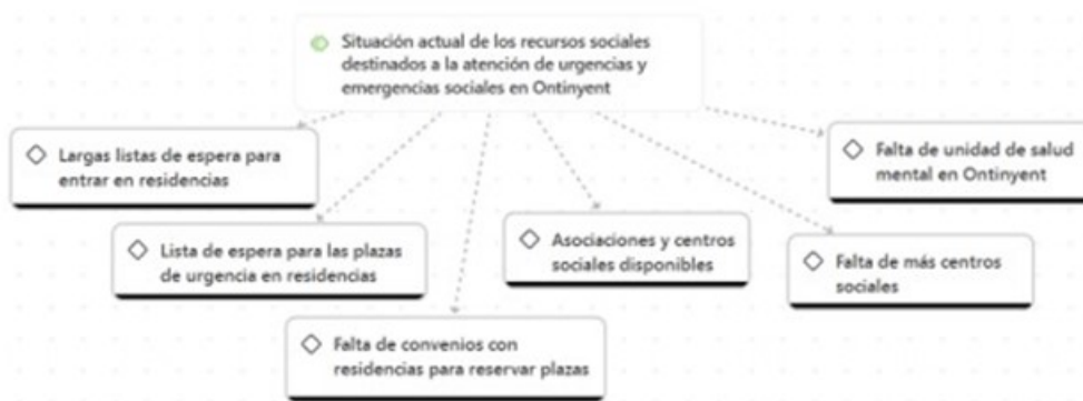
Figura 5. Situación actual de los recursos sociales destinados a la atención de urgencias y emergencias sociales en Ontinyent

En la Figura 5, se muestra la categoría Situación actual de los recursos sociales destinados a la atención de urgencias y emergencias sociales en Ontinyent , junto con sus respectivos códigos.