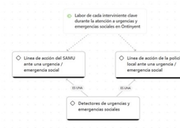
Figura 3. Labor de cada interviniente clave durante la atención a urgencias y emergencias sociales en Ontinyent