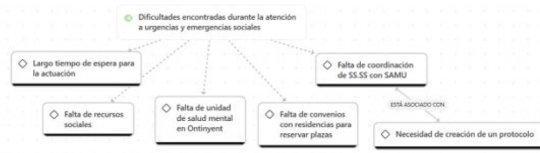
Figura 2. Dificultades encontradas durante la atención a urgencias y emergencias sociales