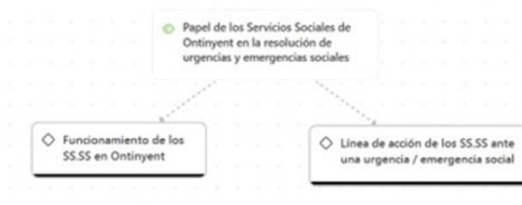
Figura 4. Papel de los Servicios Sociales de Ontinyent en la resolución de urgencias y emergencias sociales