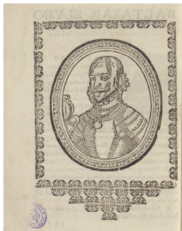
Jerusalén , 1611