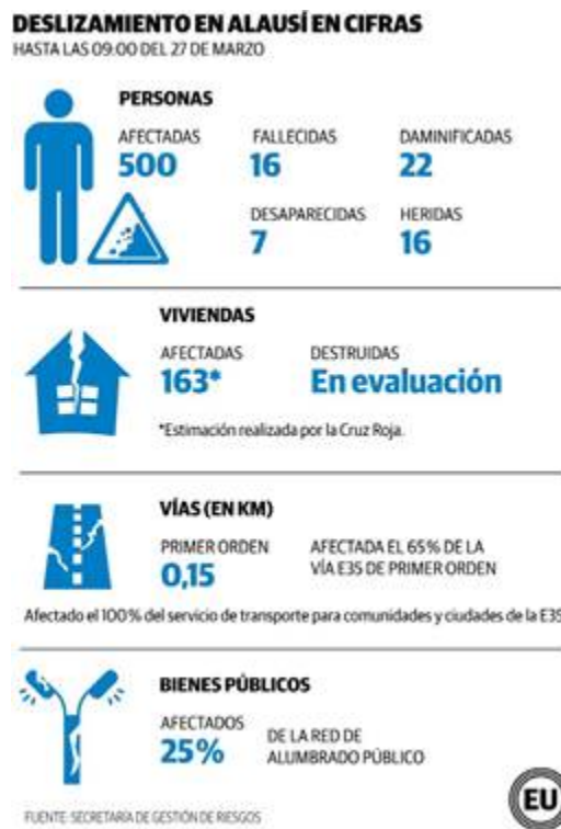
Figura 5. Afectación por deslizamiento – Alausí

El deslave ocurrido en Alausí, Ecuador, el 26 de marzo de 2023 dejó al menos 16 muertos, 7 desaparecidos y varias viviendas sepultadas. Además, 22 personas resultaron damnificadas, 163 viviendas fueron afectadas, 16 personas resultaron heridas y la vía E35, que conecta la sierra con el sur del país, sufrió una afectación del 65%. El Servicio Nacional de Gestión de Riesgos de Ecuador informó que los equipos de bomberos de varias zonas del país trabajaron en las tareas de rescate junto a la Policía, las Fuerzas Armadas, la Cruz Roja y el Ministerio de Salud, entre otras entidades. El Gobierno informó que se han activado albergues temporales y el envío de kits de dormir para quienes los damnificados (Fajardo, 2023).