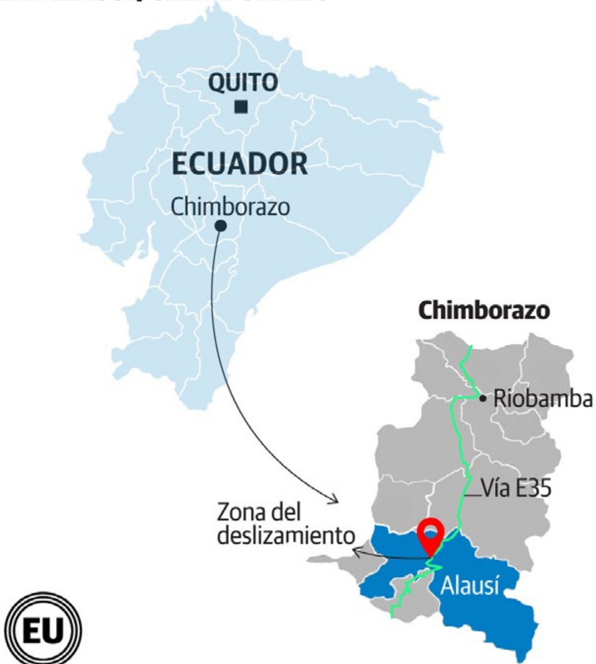
Figura 4 Área de afectación por deslizamiento - Alausí