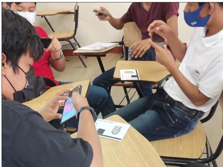
Figura 3. Estudiantes haciendo uso de una aplicación en realidad aumentada.

La convergencia de los enfoques tecnológicos pedagógicos abordada en este artículo busca orientar el desarrollo de aplicaciones de realidad aumentada que puedan ser utilizadas como herramienta de apoyo en el proceso de enseñanza-aprendizaje (figura 3). La propuesta destaca la capacidad de la tecnología para visualizar fenómenos de difícil observación o reproducción para apoyar la comprensión de conceptos abstractos y complejos, siendo las simulaciones aumentadas un mecanismo idóneo para este propósito.