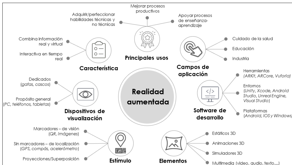
Figura 1. Consideraciones para el uso de la realidad aumentada. Elaboración propia.

En la figura 1 se presenta una síntesis de los elementos que deben ser considerados en el uso de la realidad aumentada.