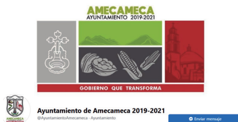
FIGURA 3. PÁGINA DE FACEBOOK

Ayuntamiento de Amecameca 2019-2021 es el título de la página de Facebook que utiliza la administración 2019-2021 (figura 3).