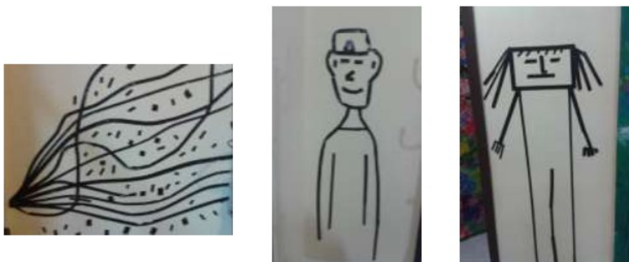
Figura 2: Desenho de crianças com fita isolante sobre paredes e portais

Fonte: Espaço de Arte Azul Anil, arquivo da autora, 2015.