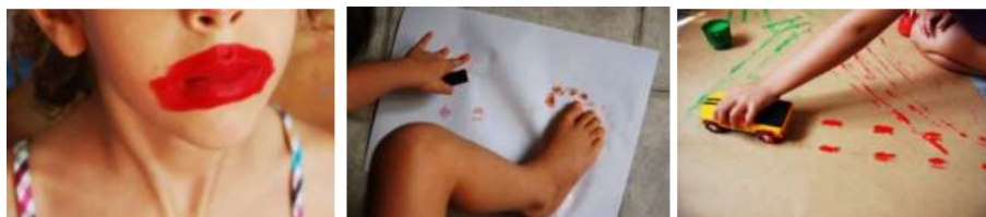
Figura 7: Pintura/desenhos com batons e carrinhos

Após a experiência com os batons, foram distribuídos carrinhos de brinquedo 3 às crianças para serem explorados e utilizados como marcadores em uma pintura coletiva em papel pardo de grandes dimensões. Pintadas com tinta guache, as rodas dos carrinhos deixavam as suas marcas por onde passavam. Em todos os grupos, tanto meninos quanto meninas exploraram os carrinhos e os rastros de tinta, compondo o papel com diversos outros elementos que se relacionavam uns com os outros (CUNHA, ibidem).