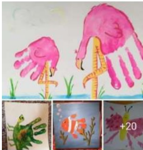
Figura 3. Pintura dirigida pela professora

Outro trabalho recorrente com pintura nas escolas é a utilização das mãos das crianças como carimbos, porém são as professoras que colocam as mãos das crianças na tinta e escolhem como e onde carimbar sobre o papel, depois complementam as formas com elementos de alguns animais como bicos, patas, focinhos. Ou seja, as crianças só tiveram a oportunidade de ter contato com a tinta pelas ações dirigidas pela professora e não de usufruir as possibilidades do ato de pintar e da tinta, sua textura, cor, cheiro, consistência e formas de marcar o suporte. É inconcebível que perdurem nas escolas esses tipos de atividade em que as crianças são usadas como instrumento pelo adulto e impossibilitadas de experimentar os materiais e os movimentos corporais.