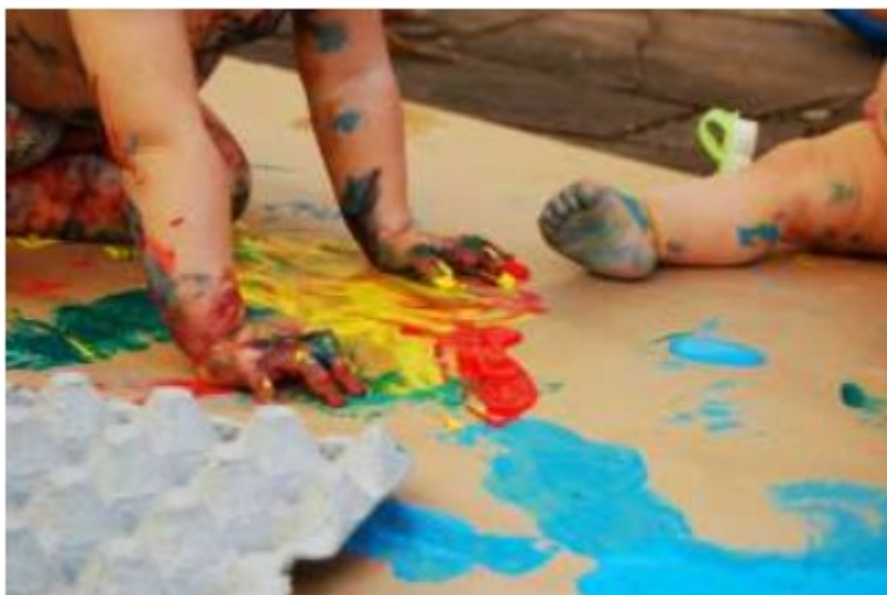
Figura 4: Crianças pintam com o corpo

Em oposição aos trabalhos de pintura, baseados em concepções ultrapassadas de ensino de arte nas quais desconsideram a autoria, a pesquisa de materiais e os processos de criação das crianças, apresento o trabalho desenvolvido no Estágio Curricular do Curso de Pedagogia, relatado no TCC, no qual Moreira inspira-se em artistas e obras contemporâneas para desenvolver as suas propostas. Segundo a autora: