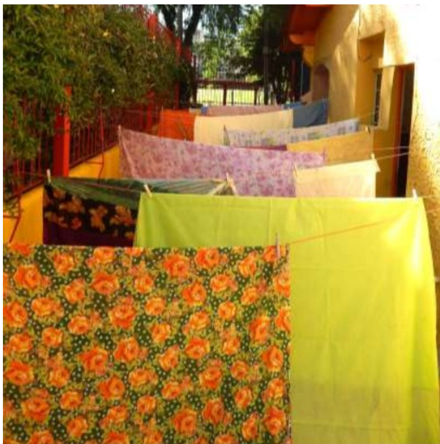
Figura 1: Caminhos possíveis

MOLINA, 2019). Por exemplo, a partir do trabalho de Ernesto Neto salientamos a perspectiva de criar instalações de jogo com tecidos suspensos, explorando diferentes tamanhos de tecidos que podem também possuir diferentes formas. Um exemplo de possibilidade de configuração, é a figura do túnel para constituir espaços de travessia e ocultação ou ainda, “bolsas” que podem conter materiais (como areia) dentro delas para dimensionar pesos variados. Outra possibilidade consiste em utilizar especiarias e chás dentro ou entre os tecidos para aguçar a dimensão olfativa na exploração da proposta. Brincar com as possibilidades de criação de instalações de jogo (RUIZ DE VELASCO GÁLVEZ; ABAD MOLINA, 2019) que proporcionem uma imersão por inteiro nelas. Nessa perspectiva de considerar a suspensão de tecidos e diferentes modos de configuração a partir das obras dos artistas, apresentamos uma instalação de jogo inspiradas em obras da artista Kimsooja 14 que formava diferentes corredores entre os tecidos.