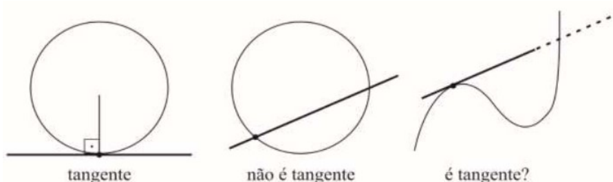
Figura 2 – Afinal, o que é uma tangente?

A palavra limite, por exemplo, é comumente entendida como uma fronteira que não pode ser alcançada. Já a noção de tangente é comumente assumida como um já-encontrado pelos professores, no início do estudo do Cálculo, e, então, utilizada livremente para se introduzir o estudo da derivada. Entretanto, Tall (2010) destaca que a noção de reta tangente, construída no contexto da geometria euclidiana, conforme ilustrado na Figura 2, leva à ideia intuitiva de que essa reta “encosta” na curva em apenas um ponto e, de forma alguma, a intercepta. Essas concepções e significados, construídos a partir de experiências prévias, nem sempre contribuem para o entendimento de novos conceitos no contexto das definições necessárias para o estudo do Cálculo.