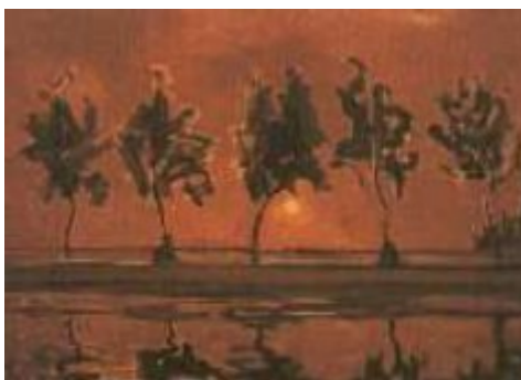
Figura 2 - Bomen aan het Gein : a lua nascente (1907, 1908) – Mondrian

Fonte: Acervo do Museu Municipal de Haia, 2021 7