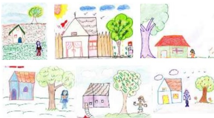
Figura 1 - As casas, árvores e figuras humanas Professoras CMEI Criar

Esse somatório de observações apontou para a organização de encontros no grupo de estudos para pensar sobre o desenho dentro de um entendimento em que a necessidade da arte e a formação estética são direitos de todas as pessoas. Entendendo ao que os debates vinham nos instigando, era preciso refletir sobre o processo de formação de repertórios. O primeiro desenho pedido às professoras foi que registrassem as formas casa, árvore e figura humana.