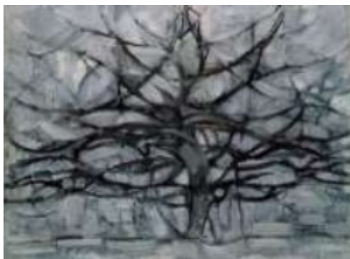
Figura 4 - Árvore cinza (1911) – Mondrian