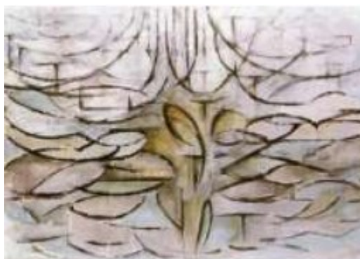
Figura 5 - Macieira em flor (1912) – Mondrian