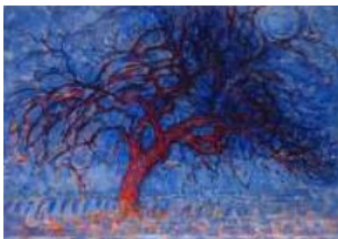
Figura 3 - Árvore vermelha (1908) – Mondrian

Fonte: Acervo do Museu Municipal de Haia, 2021 7