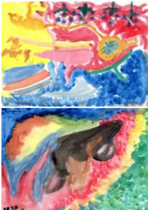
Figura 7 - Criações de aquarela sobre papel Professoras do CMEI Criar

olhar para o do outro. Eu não estou nem olhando para não me influenciar”, disse a professora Rosa enquanto criava.