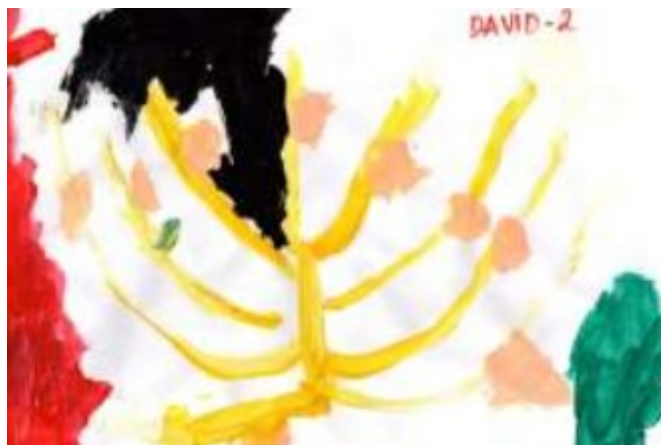
Figura 8 - A árvore amarela de David Guache sobre papel