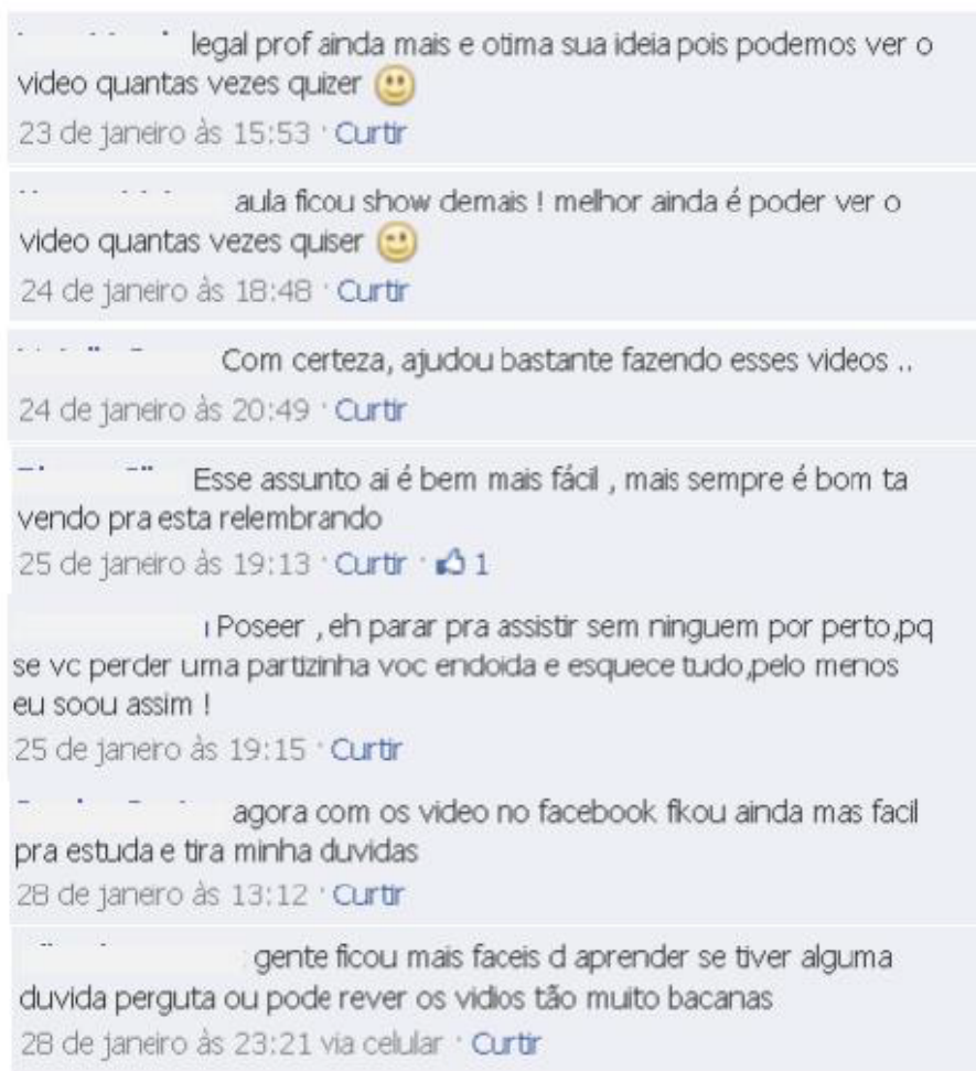
Figura 2: Captura de tela dos comentários de um dos vídeos postados pelo professor da disciplina