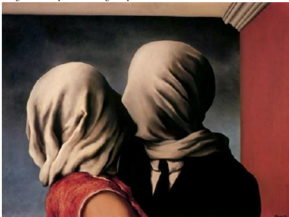
Figura 5: Os amantes, de René Magritte Fonte: René Magritte (1928).

Como a representação das qualidades e dos defeitos do amor pode ser multifacetada, o quadro Os amantes (1928), de René Magritte, foi a próxima imagem apresentada: