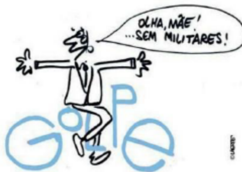
Figuras 2: Olha, mãe!... Sem militares.

Os procedimentos injuntivos do poema anterior também estão presentes no “conto” “Instruções para chorar”, de Júlio Cortázar. (1994, p. 7-8). Embora haja a impressão de se tratar de um texto fortemente eivado com os valores do encargo, distanciado do acontecimento histórico, da ficção e aproximado do gênero discursivo “receita”, ainda assim é difícil distanciar-lo da definição de literário. Afinal, o que julgava pertinente debater nessa aula era como uma produção interartística poderia ser considerada literária e desembocar em um tema político. A esse respeito, fiz a ressalva de que definir o literário se trata de uma correspondência interna, subjacente e, muitas vezes, anterior ao amparo estético de uma obra de arte/literária (RANCIÈRE, 2009). Em outras palavras, livro, escultura, quadro, HQ, etc. erigem sua estética em posicionamentos políticos do artista e de seu público. Para debater esse enlace entre literatura e política, lemos em sala de aula duas tirinhas da cartunista Laerte Coutinho (2016; 2014?) engendradas em um conteúdo eminentemente político e verbal: