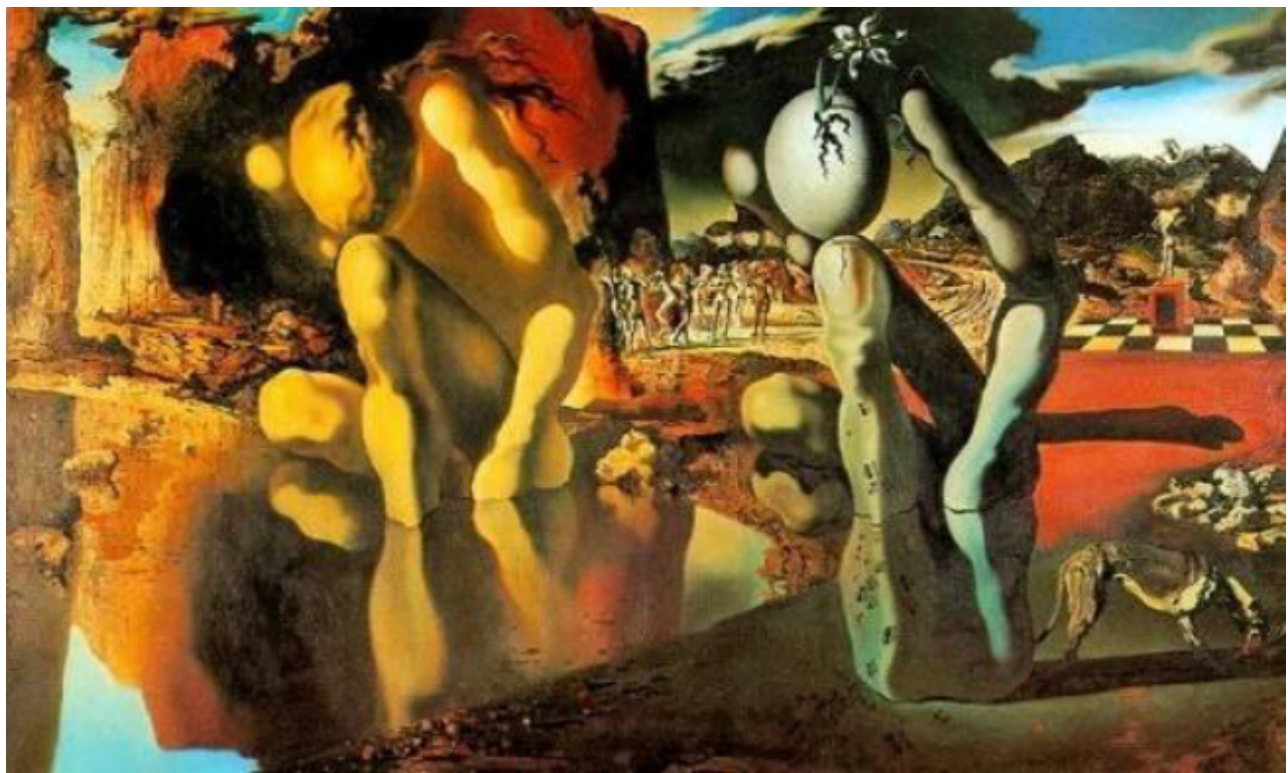
Figura 4: Metamorfoses de Narciso, de Salvador Dali. Fonte: Salvador Dali (1937)

Como a representação das qualidades e dos defeitos do amor pode ser multifacetada, o quadro Os amantes (1928), de René Magritte, foi a próxima imagem apresentada: