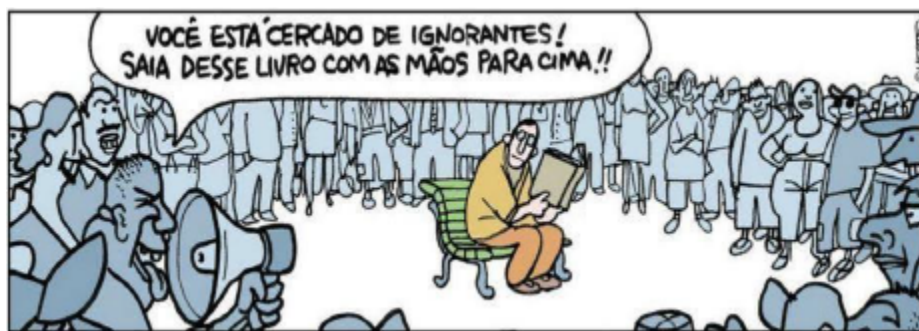
Figuras 3: Você está cercado de ignorantes!