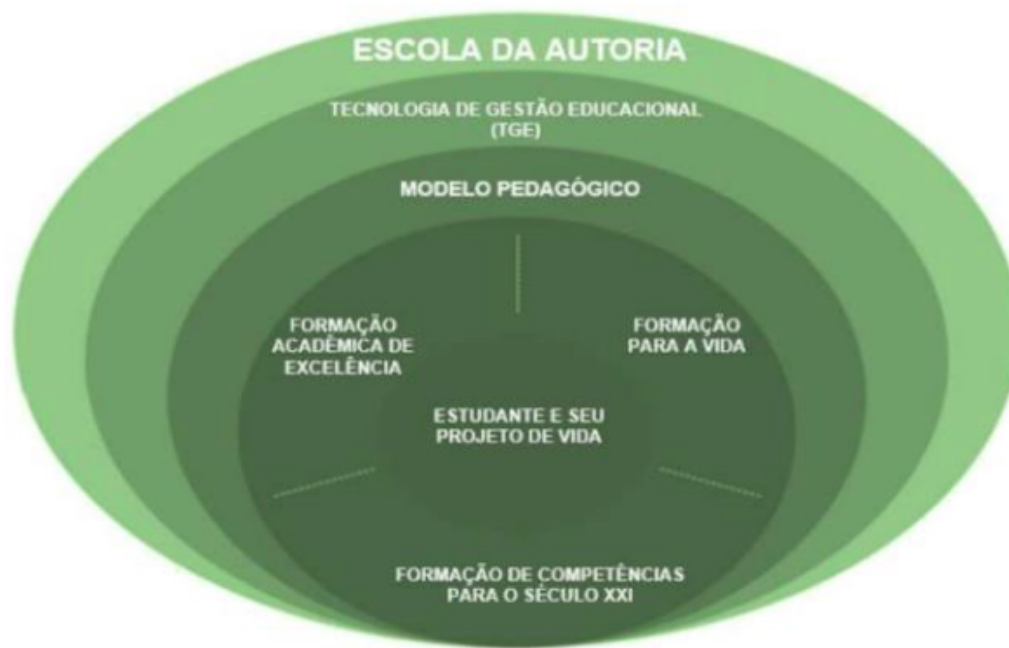
Figura 2 - Três eixos formativos da Escola da Autoria

Observe também a figura 2, abaixo, que sintetiza a visão da Escola da Autoria para os Estudantes: