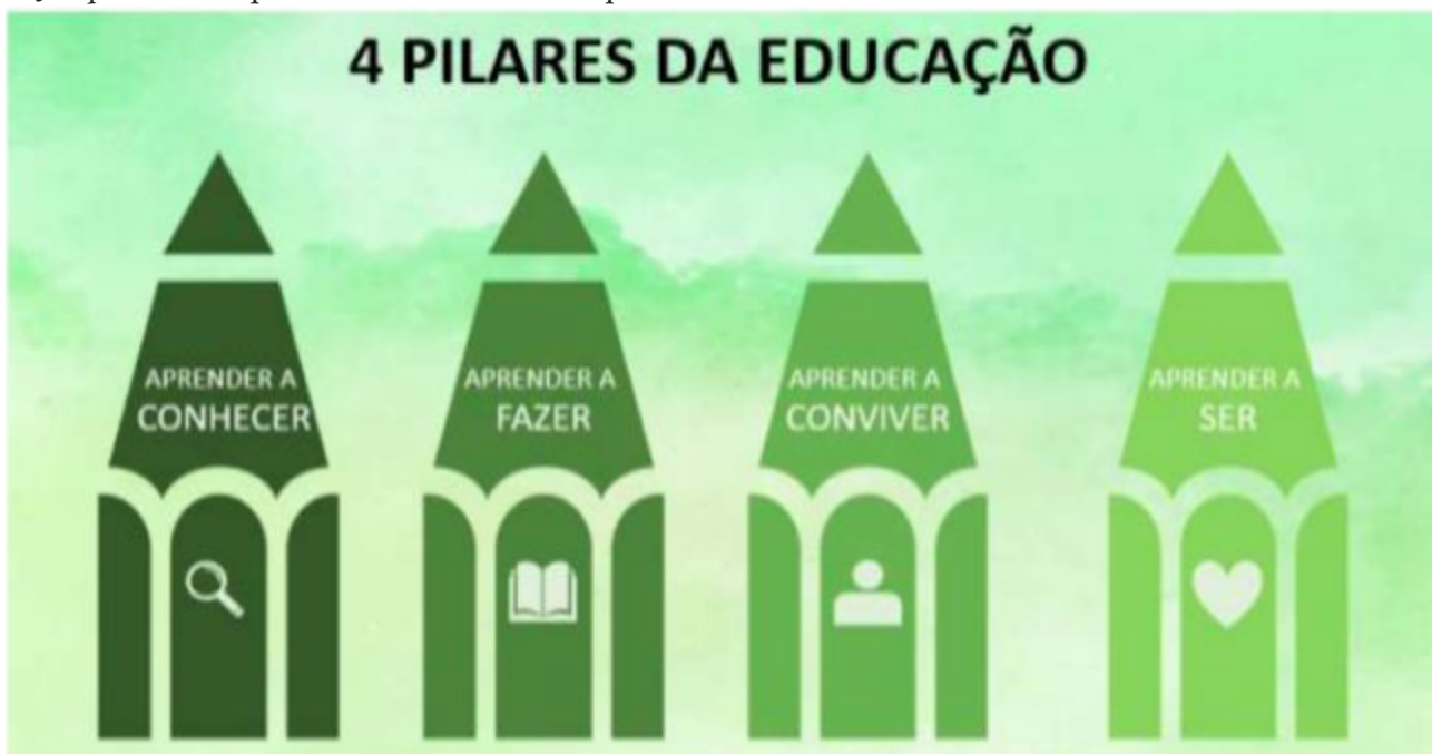
Figura 3 - Quatro pilares da educação para a formação continuada - Escola da Autoria

Em relação aos Educadores, a Escola da Autoria exige que a formação continuada aconteça conforme as perspectivas dos quatro pilares da educação, inspirada nos conceitos de fundamentos da educação baseados no Relatório para a UNESCO da Comissão Internacional Sobre Educação para o Século XXI (1996) coordenado por Jacques Delors, político e economista europeu de nacionalidade francesa.