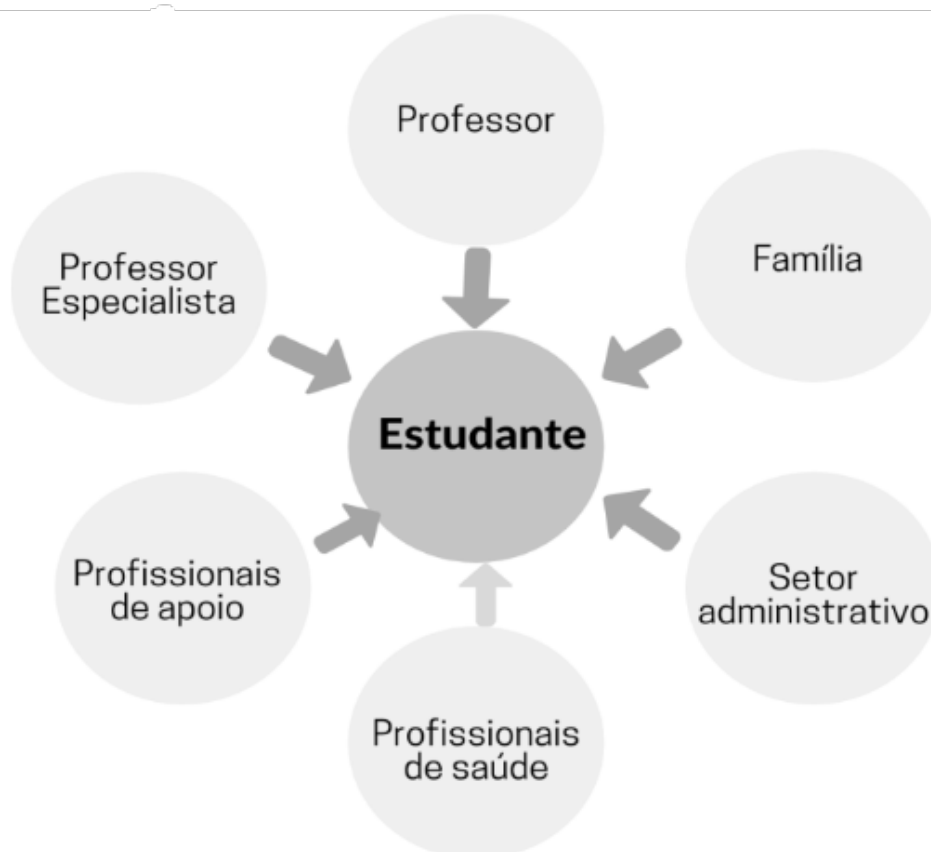
Ilustração 1 – Uma abordagem egocêntrica relacionada apenas a um estudante numa relação de partilha de responsabilidade entre saúde, educação e família

Baseados no esquema a seguir, disposto na Ilustração 1, a abordagem egocêntrica propõe a eliminação de barreiras de cada estudante que evidencia características diferenciadas, tratando a individualidade e a singularidade com evidência.