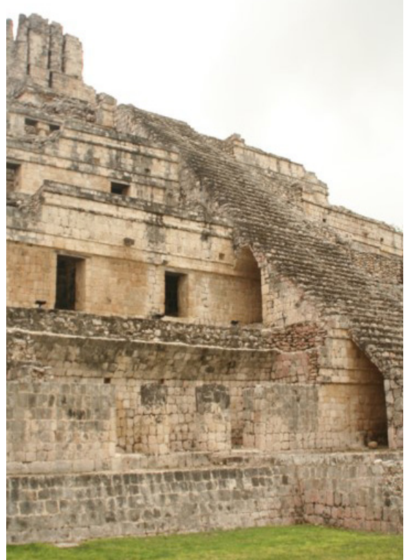
Imágenes 5 y 6: El uso de los arcos dentro de la arquitectura maya permitía dar permeabilidad a sus cuerpos geométricos, tanto como una mayor accesibilidad y circulación, así como proporcionar mayor ligereza al espacio. Arriba se aprecia un arco que penetra las escaleras en Kabah. Ruta Puuk. Abajo, el mismo sentido en Edzná.