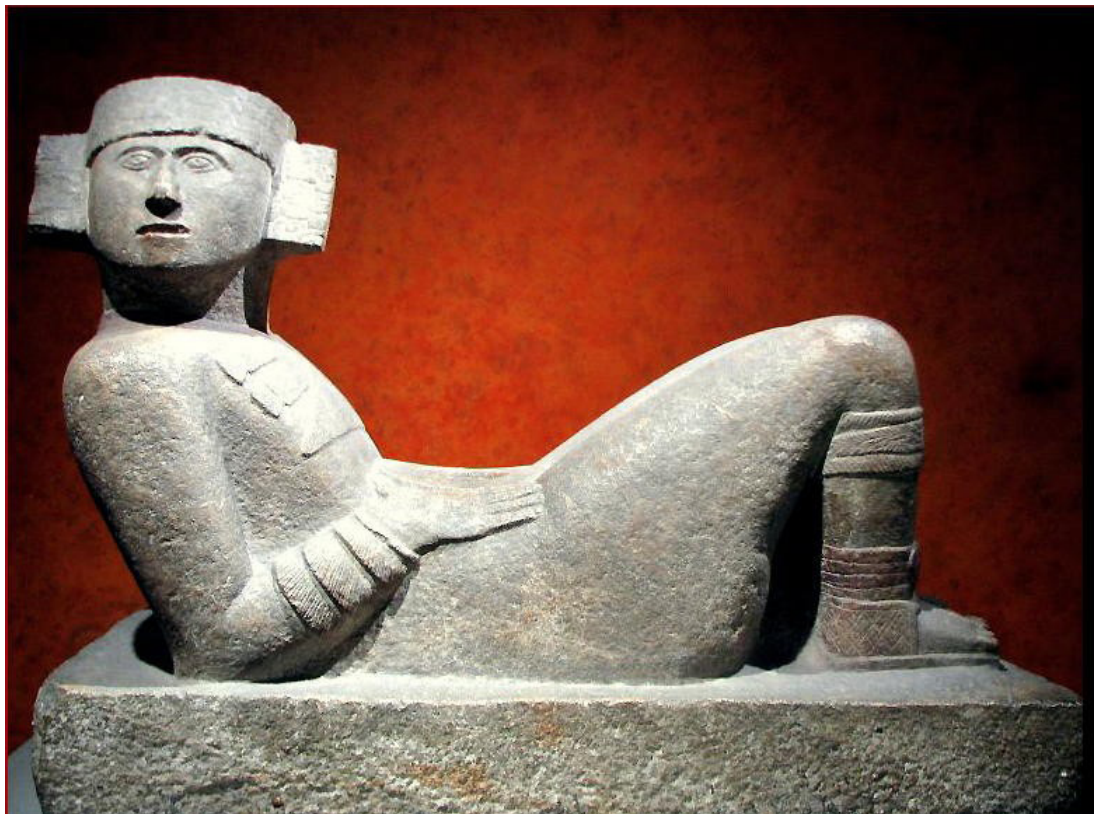
Imagen 2. Chack Mool (Chichen Itzá).