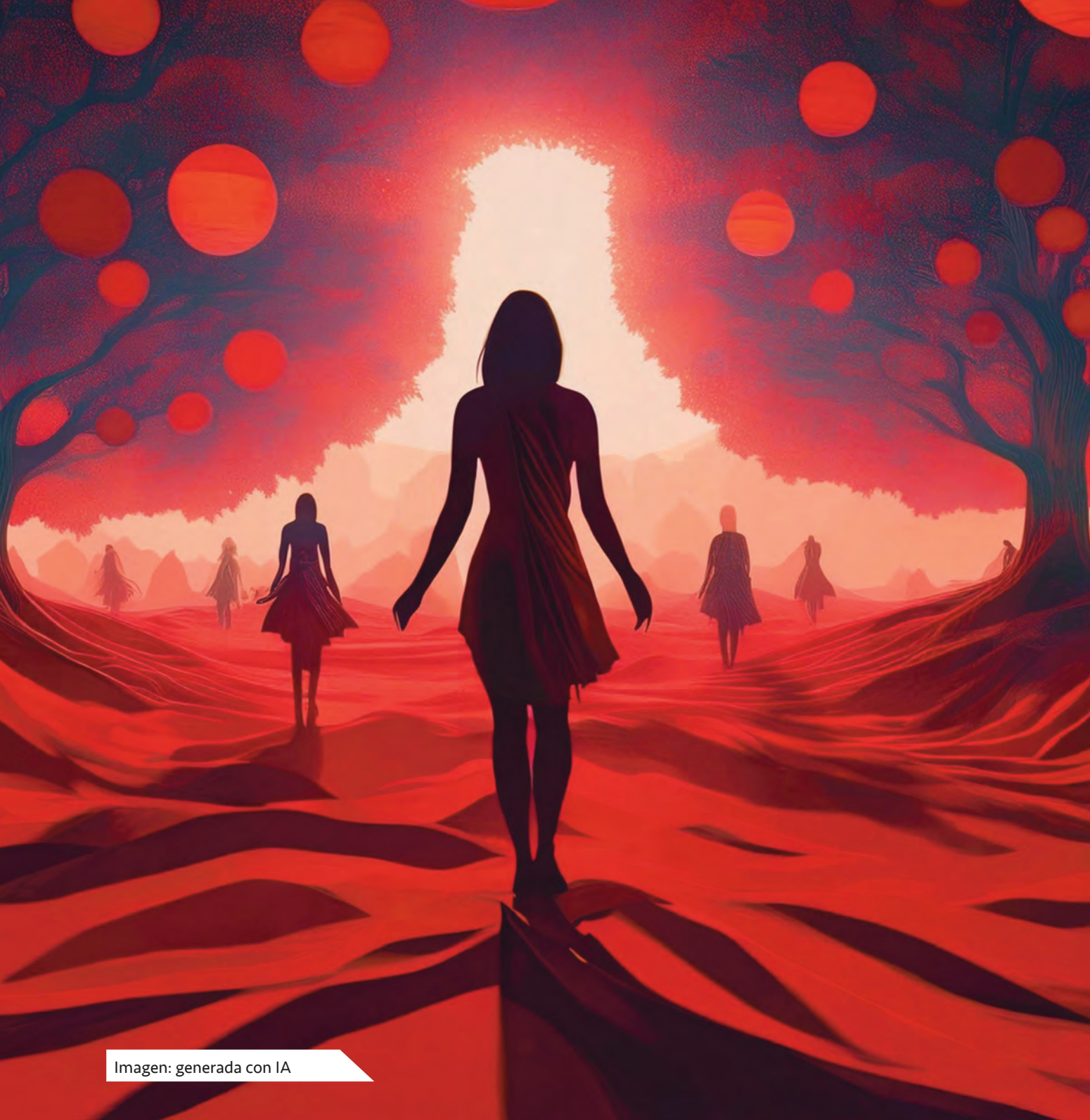
Imagen: generada con IA