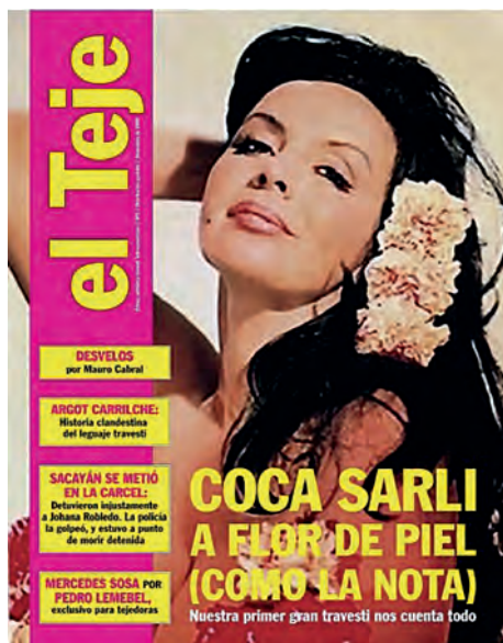
Figura 2. Tapa de El teje , número 5 (2009).

de Argentina, en los años setenta. La otra imagen, en 2009, se publica el número 5 de El Teje , el primer periódico travesti latinoamericano (Figura 2).