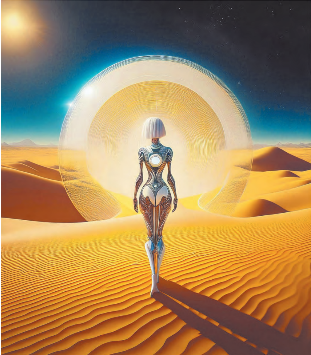
Imagen: generada con IA