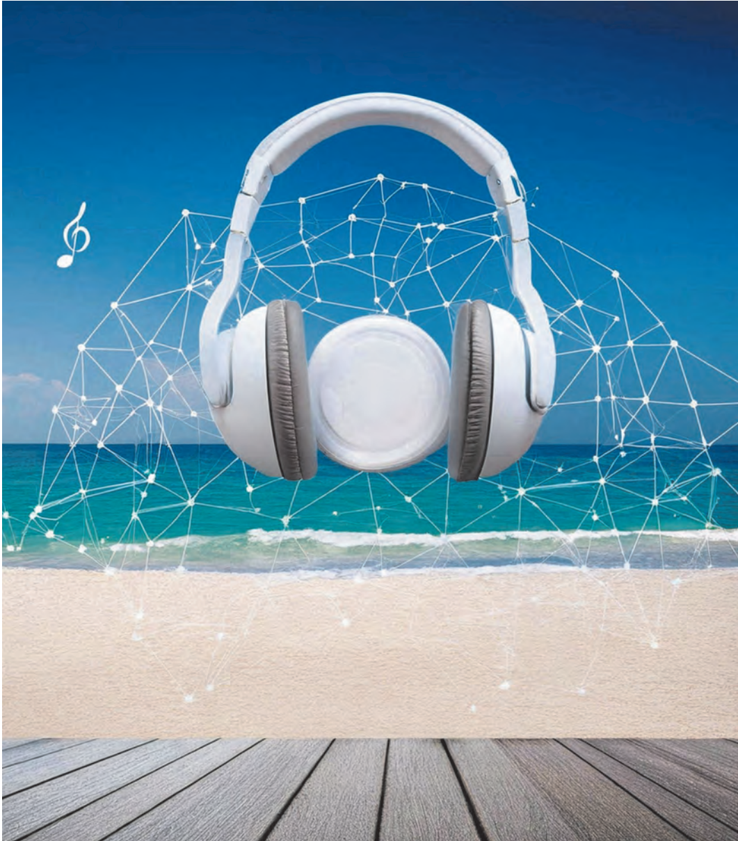
Imagen: generada con IA