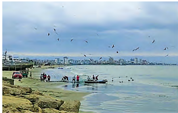
Figura 2. Actividad pesquera artesanal en "Playa de los Esteros"

El análisis de los componentes gráficos de Manta revela que su identidad está fuertemente vinculada con su ubicación costera y su tradición pesquera (Figura 2), combinada con una creciente influencia turística y comercial.