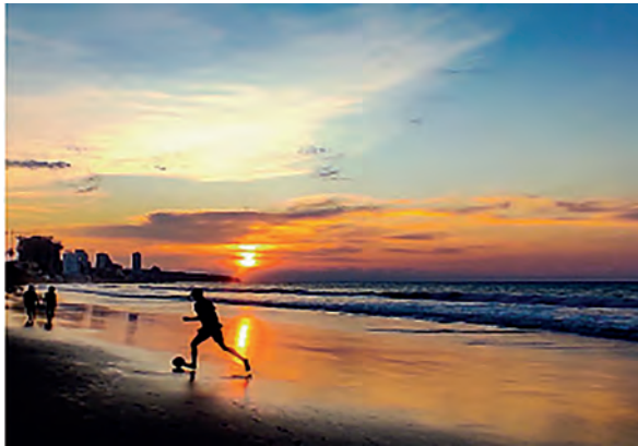
Figura 3. Playa “El Murciélago” de Manta.

hasta los espacios públicos que celebran su rica tradición marítima. Durante un periodo de cinco días, se realizaron recorridos por diferentes áreas de la ciudad, documentando aspectos clave que resaltan su identidad gráfica.