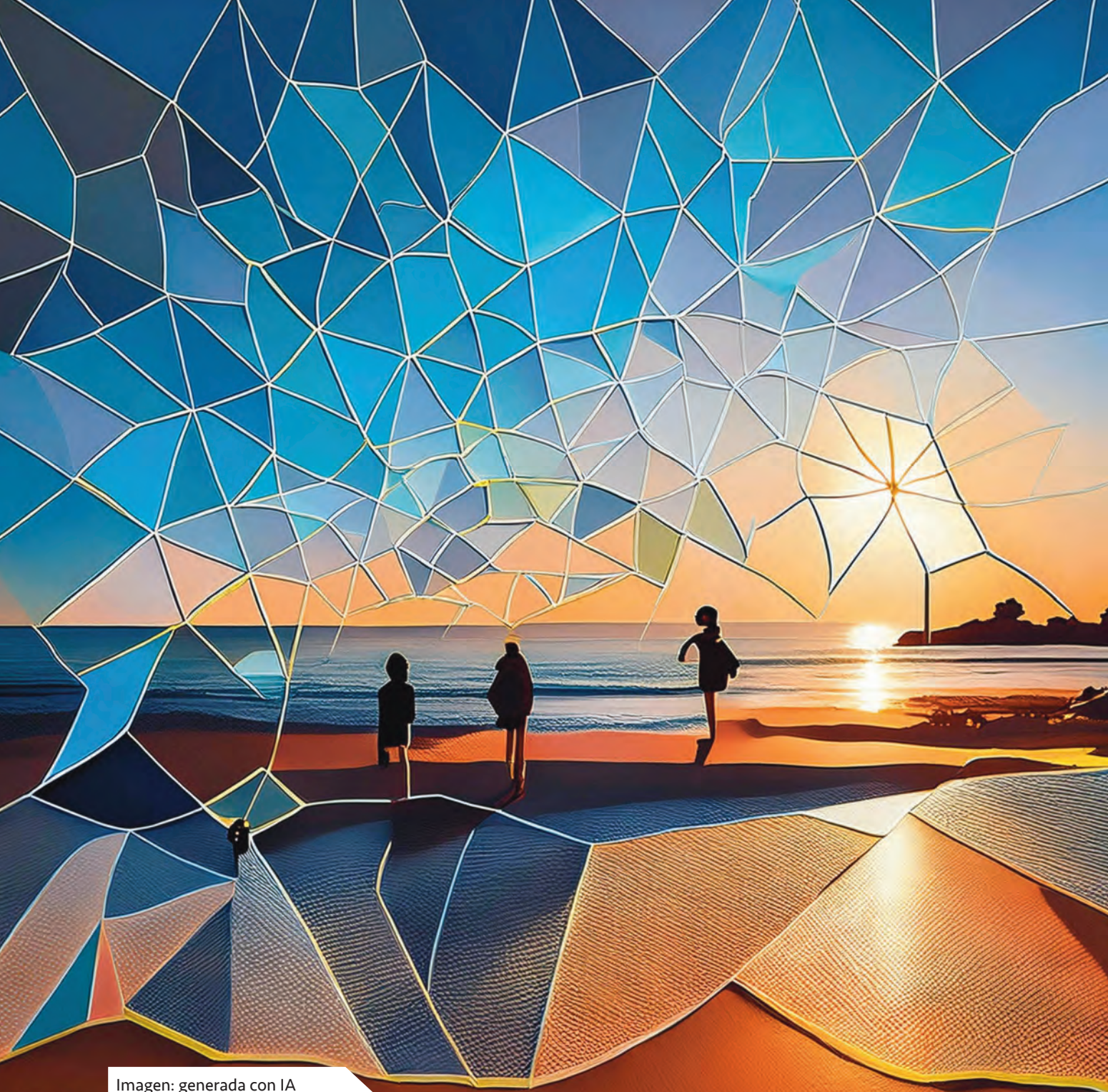
Imagen: generada con IA