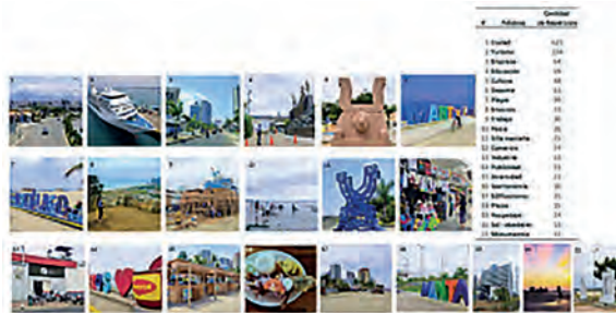
Figura 4. Relevamiento fotográfico de la diversidad visual de Manta.

hasta los espacios públicos que celebran su rica tradición marítima. Durante un periodo de cinco días, se realizaron recorridos por diferentes áreas de la ciudad, documentando aspectos clave que resaltan su identidad gráfica.