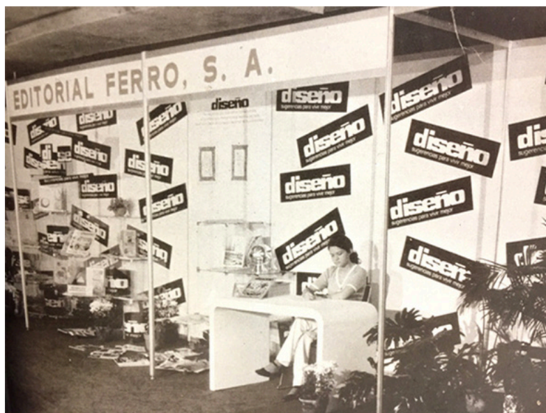
Imagen 10. Editorial Ferro, S. A., en Expo-mueble 1973, "Expo-mueble 73", Diseño , año 3, núm. 53 (octubre de 1971). Hemeroteca Nacional de México.