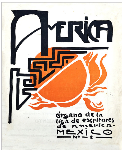
Dr. Atl, portada de la revista América , núm. 2 (febrero de 1926).