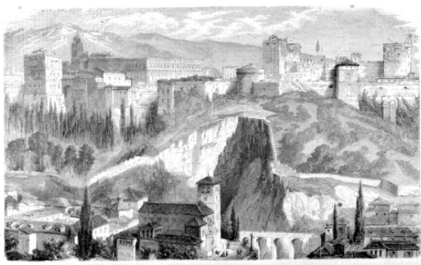
Imagen 6. “Vista general de la Alhambra tomada más arriba de la iglesia de san Pedro y san Pablo”, El Correo de Ultramar. Parte Literaria e Ilustrada Reunidas , núm. 480 (1862): 187.

La llegada a Andalucía activa el estereotipo y los ecos literarios: “Ya estoy en Andalucía, el país de las guitarras, de las navajas, de las mantillas, de los ojos negros, de las citas nocturnas, de los paseos para tomar el sol”, pero al observar atentamente se descubre una sociedad industriosa, enfocada en el porvenir. La Alhambra provoca sensaciones semejantes a las del visitante nacional, en tanto encrucijada de ricas culturas: “¡La Alhambra! ¡Granada! ¡nombres mágicos, recuerdos poéticos, que apenas son inferiores a los de Grecia y Roma! ¿Quién no ha soñado una vez en su vida una peregrinación a ese santuario de arte árabe en España?”. 61