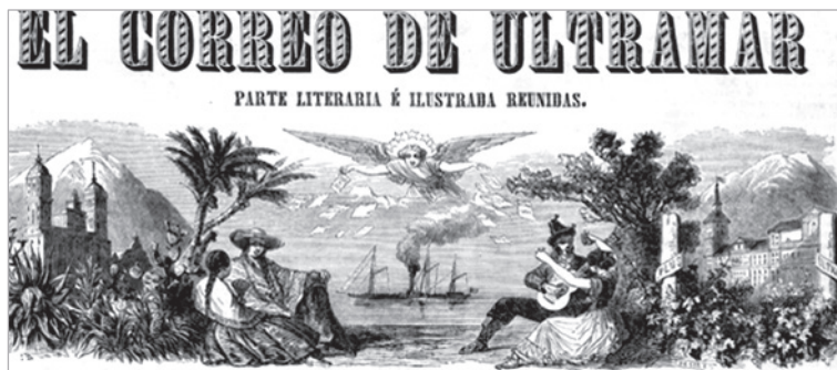
Imagen 1. Cabezal de El Correo de Ultramar. Parte Literaria e Ilustrada Reunidas .

(1842-1886). 11 Llama la atención que la cabecera, como ha explicado Raquel Gutiérrez Sebastián, 12 dibuje dos geografías separadas por un océano, representado con gran estrechez para simbolizar su cercanía. Un vapor funciona de puente entre ambos extremos, donde dos parejas con atavío costumbrista, dos paisajes y dos edificios monumentales evocan ambas orillas. Un ángel lanza páginas desde lo alto, como muestra de los vínculos culturales entre ellas.