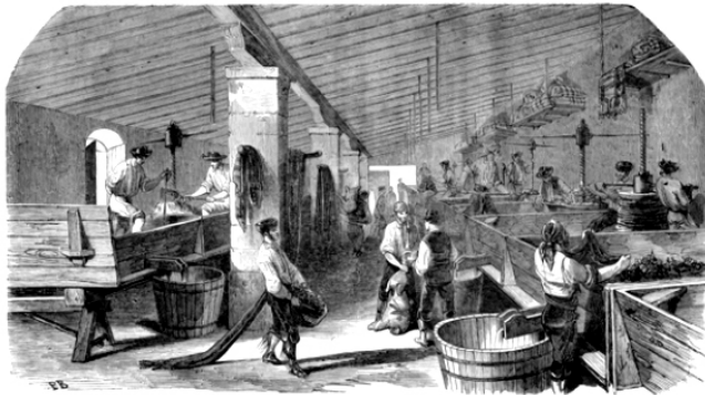
Imagen 3. “Fabricación del vino de Jerez. – Los lagares”, El Correo de Ultramar. Parte Literaria e Ilustrada Reunidas , núm. 52 (1853): 82.

La narración “Jerez de la Frontera” podría ser considerada de “turismo enológico”: “Hoy voy a desquitarme hablando de Jerez y de su rico vino”. El paseante que busca conocer los monumentos del lugar descubre un vigoroso negocio: “Salí por aquellas calles buscando algún monumento curioso y pintoresco que dibujar, pero solo encontré grandes, enormes bodegas”. A partir de este hallazgo, “no sentí el tiempo perdido, pues por las anchas ventanas de estas bodegas se escapaba un fuerte perfume que embalsamaba toda la ciudad y que yo saboreaba con un sensualismo insaciable”. 36 Aquí se describe con diligencia esta industria, apreciada por su alto valor gastronómico. Los procesos de producción, la vida de sus jornaleros y las posibilidades de exportación merecen atención. El texto se acompaña de grabados donde se plasma la vendimia, la fabricación del vino, la confección de los barriles, etcétera.