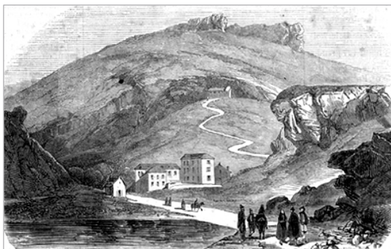
Imagen 4. "Una excursión a Panticosa. La casa de baños", El Correo de Ultramar. Parte Literaria e Ilustrada Reunidas , núm. 145 (1855): 240.

El paraje es, nuevamente, fuente de vanagloria para sus naturales. Panticosa tampoco es un lugar elegido al azar, sino que posee su propia mitología histórico-literaria. 56