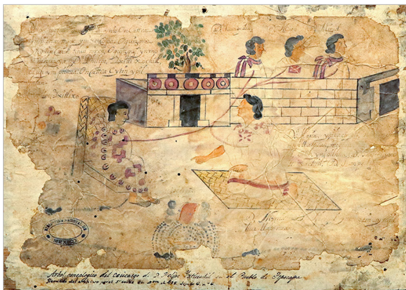
Detalle del “Árbol genealógico de Felipe Ixtlisochil en el pueblo de Tepecapa”, Ms. 1809, Fondo Reservado de la Biblioteca Nacional de México.

Con la portada de este número de Bibliographica rendimos homenaje a doña María Yxtilixochitl (lado derecho) y nos sumamos a la conmemoración del Año de la Mujer Indígena, declarado así por el actual gobierno mexicano. La imagen es un detalle del códice Genealogía de Yxtilixochitl (Ms. 1809), custodiado por la Biblioteca Nacional de México (disponible en línea), donde la vemos acompa-