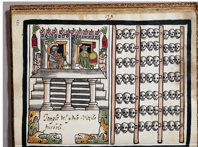
Figura 2. "2ª. Templo del ydolo Uitzilopochtli", Tovar Codex , https://archive.org/details/tovarcodex00tova/page/243/mode/2up?view=theater .

Más de 20 años después, José Mariano Beristáin de Souza afirmó en su Biblioteca hispano-americana septentrional que Tovar fue el autor de una Historia antigua de los Reinos de Méjico, Acolhuacan y Tlacopan , la cual había servido a Acosta. Probablemente, José Mariano no conoció directamente el texto de Tovar y por ello lo bautizó con ese nombre. 24 Llama la atención el hecho de que la obra conocida de Tovar abarca principalmente la historia mexicana-tenochca, condición que no coincide con el título de Beristáin ( Méjico, Acolhuacan y Tlacopan ), por lo que es posible pensar que se confundiera la primera obra del jesuita (la cual, según el mismo religioso, abrevó de testimonios mexicas, tetzcocanos y toltecas) con la segunda, basada en fray Diego Durán.