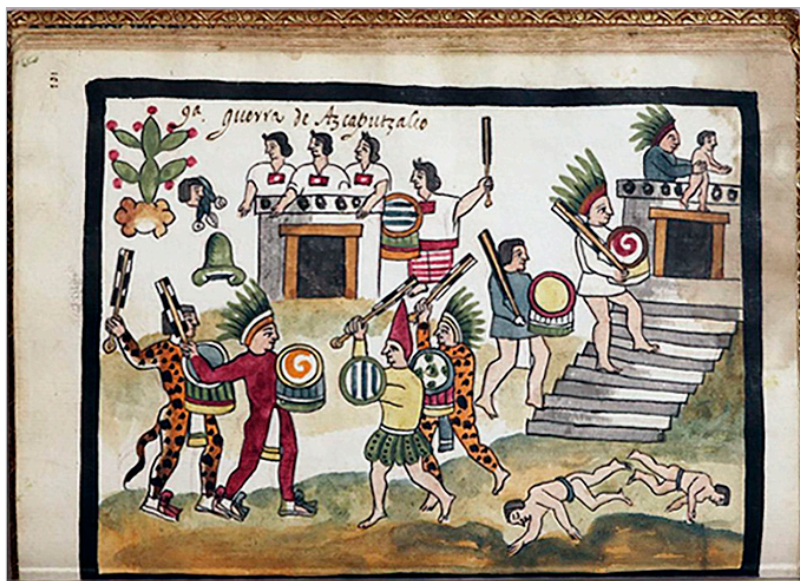
Figura 4. "9ª. Guerra de Azcapuzalco", Tovar Codex , https://archive.org/details/tovarcodex00tova/page/201/mode/2up?view=theater .

¿por qué, a pesar de haber sido posteriores a las de la Historia de Durán, las láminas de Tovar presentan elementos iconográficos que parecen anteriores? ¿Tuvo el padre Tovar en sus manos el ejemplar que conocemos como Historia de Durán o es posible que haya existido otro ejemplar, distinto, de ella? Si Juan de Tovar no se sirvió de los modelos de la obra de fray Diego para realizar sus láminas, ¿a qué fuente, semejante en su composición a la obra de Durán, pudo haber recurrido? ¿Por qué razón las láminas del Códice Ramírez parecen inconclusas? 53