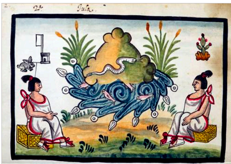
Figura 1. “2ª. Tula”, Tovar Codex , https://archive.org/details/tovarcodex00tova/page/173/mode/2up?view=theater .

de esta gente con certidumbre”. 5 Posteriormente, Enríquez envió los antiguos documentos a Juan de Tovar, mediante el provisor del arzobispado de México, conocido simplemente como el doctor Portillo, a quien encomendó la tarea de elaborar una relación histórica dirigida al monarca hispano. Tovar, pese a ser un hábil hablante de náhuatl, no comprendió el contenido de las “antiguas librerías”, ya que quizá estaban compuestas por códices prehispánicos o novohispanos muy tempranos. El estudioso jesuita solicitó el apoyo de los sabios indígenas de Tenochtitlán, Tetzaco y Tula, depositarios de la tradición oral de sus antepasados y de los conocimientos necesarios para interpretar sus registros escritos, quienes le narraron la historia que terminó asentando en su obra. 6