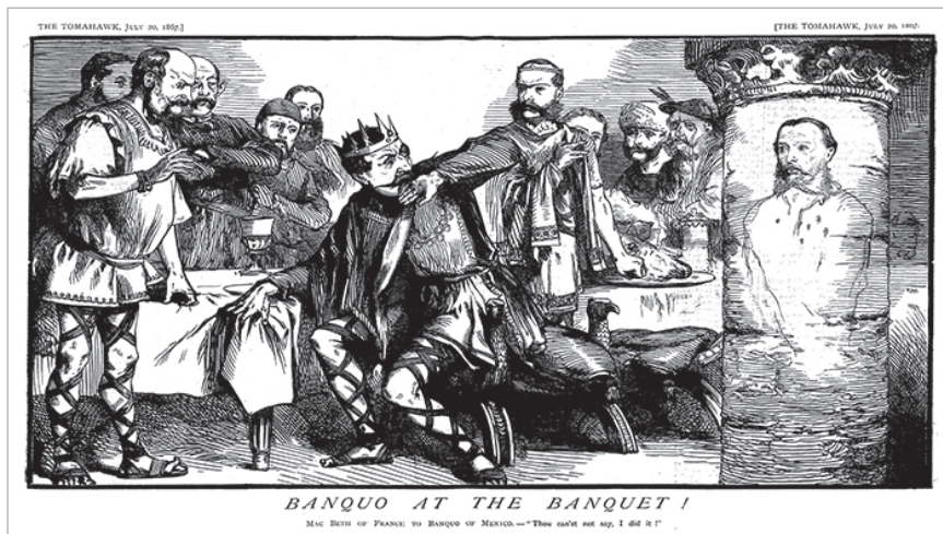
Figura 3. Matt Morgan, "Banquo at the Banquet", The Tomahawk , 20 de julio de 1867: 4-5, Nineteenth-Century Serials Edition, https://ncse.ac.uk/periodicals/t/issues/ttw_20071867/page/4/articles/pc00401/ .

la columna derecha del salón y con la camisa que lleva las balas recibidas en Querétaro el 19 de junio de ese año.