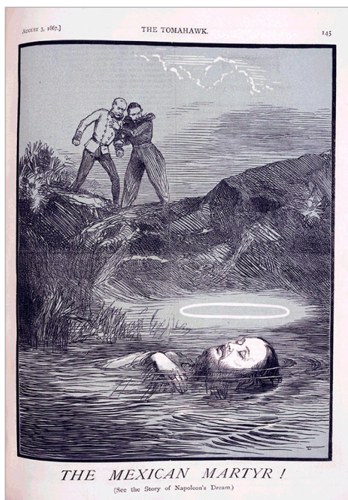
Figura 4. Matt Morgan, "The Mexican Martyr!", The Tomahawk , 3 de agosto de 1867: 145, Nineteenth-Century Serials Edition, ncse.ac.uk/periodicals/t/issues/ttw_03081867/page/5/ .

En la imagen del artista francés (1855) se representa a una joven cristiana atada de manos y coronada con una aureola, precisando su estatus de mártir (Figura5). Representó la persecución de los cristianos por Diocleciano en el imperio romano a inicios del siglo IV. La joven representada en su negativa a adorar a dioses paganos decidió arrojar al río Tíber. A la distancia, dos testigos vislumbran la escena desde la orilla del río. Mientras en la pintura de Delaroche se trata de dos cristianos, en la caricatura de Morgan hallamos nuevamente al emperador austriaco Francisco José y a Napoleón III. Sin embargo, en esta composición la imagen del Bonaparte está situada en un segundo plano al fondo, y ya no es el protagonista principal de la escena. La figura del emperador austriaco Francisco José aparentemente tiene la intención de rescatar el cuerpo de Maximiliano, pero es detenido por Napoleón III.