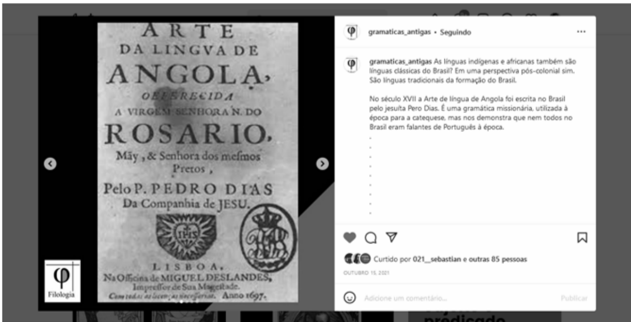
Figura 5. Arte da língua de Angola (KALTNER, 2020a).

Por fim, nessa postagem, objetivamos proporcionar um primeiro contato com a obra, sem o intuito de gerar um debate acadêmico de tópicos linguísticos, como ocorre nos eventos científicos e textos no formato tradicional. A finalidade é transformar o documento em uma notícia no Instagram , divulgar a sua existência e um campo científico que o pesquisa, trazendo um dos possíveis problemas de pesquisa que os linguistas abordam na descrição do documento. Na próxima seção do artigo, debatemos o modelo teórico que orienta nossa seleção de temas para a página, para a divulgação da história do pensamento linguístico no Brasil.