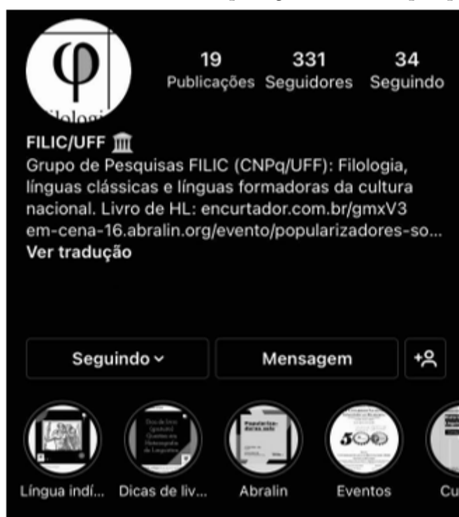
Figura 1. Página inicial (KALTNER, 2020a).

Esta é a página inicial, em imagem retirada de uma captura de tela. Todo o layout das publicações é padronizado, em cores e formas constantes, sendo as postagens elaboradas pela plataforma Canva :