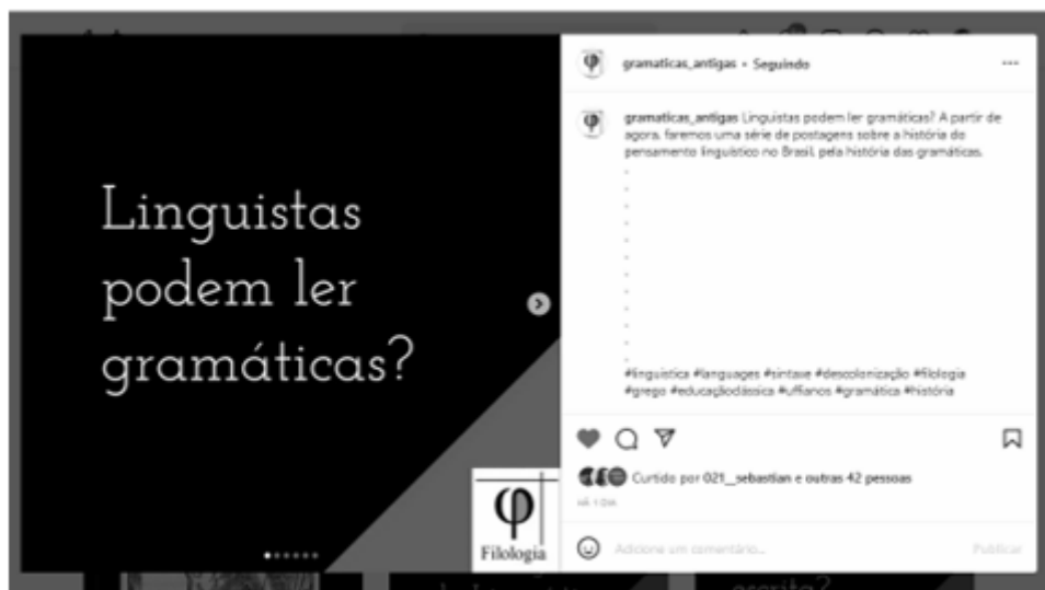
Figura 3. Postagem sobre gramáticas (KALTNER, 2020a).

A resposta à pergunta é que os linguistas da área de HL leem as gramáticas pela área de gramaticografia, a história da gramática. Na postagem da página, não especificamos quais eram os “linguistas” a que nos referíamos, pelo fato de ser uma postagem para a divulgação científica, assim o termo linguista foi generalizado. As postagens subsequentes definem o que é a gramaticografia para o público leigo e dá um exemplo de uma gramática do século XIX, que foi utilizada no Brasil.