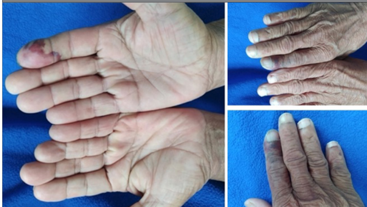
Figura 1: Imágenes de un paciente con COVID-19 y signo del dedo azul.

diferentes trastornos vasculares cutáneos, como livedo racemosa y púrpura retiforme, perniosis, isquemia digital y gangrena, incluso en ausencia de algún tratamiento vasopresor, siendo todo resultado de fenómenos de disfunción microvascular y eventos microtrombóticos inducidos por la infección viral 35 . En la Figura 1 se observa un paciente con COVID-19 que se presentó con signo del dedo azul al Servicio de Urgencias.