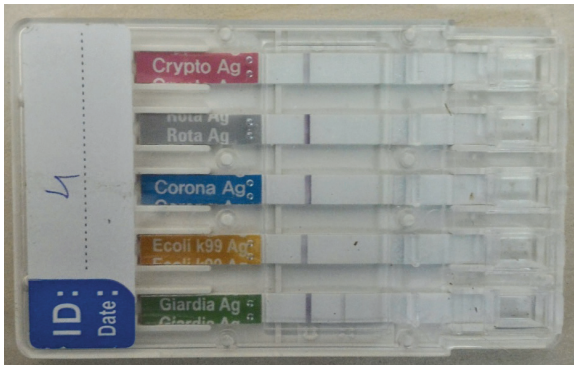
Figure 6. One of the infected calves analyzed on Anigen Bovid 5 Rapid Test Kit; Giardia antigen positive.

treatment group calves showed cyst counts ranged between 8000-280000 on D0, whereas fecal samples without any detectable cysts of Giardia sp. included samples from all calves on days 7 and 10 (Table 3). On days 7 and 10, after secnidazol treatment, the percentage reduction in cyst excretion calculated based on geometric mean was 100%. In treatment group geometric mean for cyst excretion was significantly decreased ( p < 0.001 ) after treatment. Between groups there were significant differences on days 3, 7, and 10 ( p < 0.01 ) (Table 4).