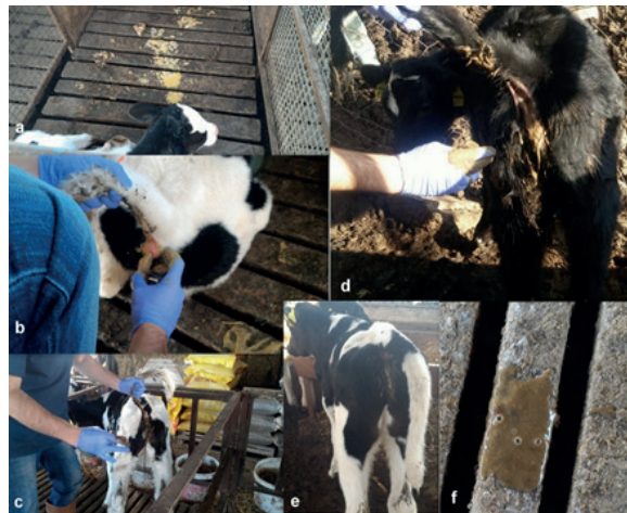
Figure 3. Clinical findings among calves with giardiasis; a) diarrhoea stools scattered in the middle, the animal is reluctant to move. b, c, d) Diarrhoea findings of giardiasis in different colors and concentrations in different animals. e) The posterior part of the wet rectum surrounds and the tarsal joints were dirty with stool. f) Giardia sp. associated stool on to the floor.

Hallazgos clínicos. Un total de 18 terneros fueron matriculados (n = 4 Simmental y n = 14 terneros Holstein). Los terneros fueron clasificados al azar en los grupos. La ubicación geográfica de las empresas y los datos demográficos con respecto a las fotos de los casos a los que se incluyeron y se muestran en el mapa de Google (Figura 1). Se incluyeron todas las explotaciones de pequeña escala (Figura 2) localizadas en el municipio de Aydin en Turquía con datos geográficos: latitud: 37.8502777778, longitud: 27.84166666670". Se observaron signos clínicos de diarrea entre todos Terneros como se muestra en la figura 3.