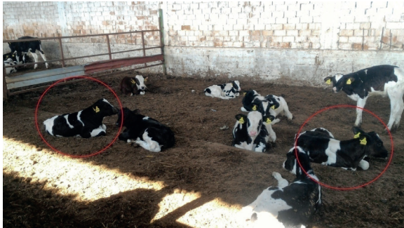
Figure 2. Umurlu/Balci farm, where 9 calves were residing at the same area, to those of which diarrhoea was detected 2 calves with giardiasis.

Haematological and serum biochemical analysis. Among aforementioned parameters there was no intragroup or intergroup differences, as detected by mean values and statistical analysis, which were shown in tables 2 and 3.