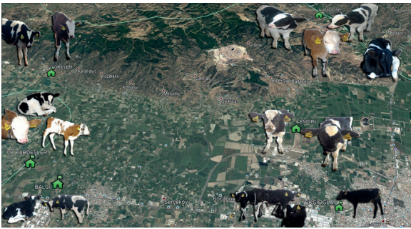
Figure 1. The geographical locations of the enterprises and demographic data regarding photos of the cases to those of which were included and shown on Google map.

Clinical findings. A total of 18 calves were enrolled (n=4 Simmental and n=14 Holstein calves). Calves were randomly classified into the groups. The geographical locations of the enterprises and demographic data regarding photos of the cases to those of which were included and shown on Google map. (Figure 1). All small scaled farms (Figure 2) were included in Aydin municipality of Turkey with geographic data: latitude: 37.8502777778, longitude: 27.84166666670. Clinical signs of diarrhoea were observed among all calves as shown in figure 3.