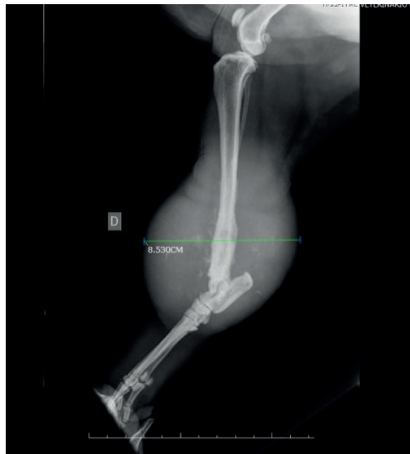
Figure 2. Lateral radiograph of periosteal osteosarcoma involving the canine right tibia. The tumor displays an active periosteal reaction and homogeneous soft tissue mass adjacent on the distal third of the tibia and is consistent with an aggressive bone lesion.

Treatment approach. Due to these findings, surgery was the first method of treatment and pelvic limb amputation was suggested to the client. The surgery was performed with no complications and the entire pelvic limb was sent to the Department of Veterinary Pathology of the School of Agrarian and Veterinary Sciences (FCAV/UNESP).