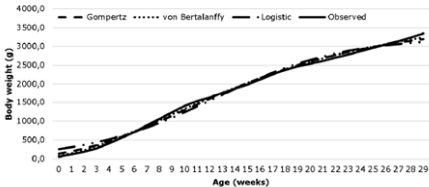
Figura 2. Curvas de crecimiento para el peso corporal previsto y observado de pavo hembra local en México.