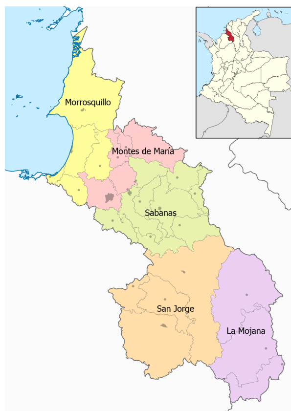
Figura 1. Ubicación zona de estudio, subregión sabana, departamento de Sucre Colombia.

Localización. Se caracterizaron 520 animales adultos criollos (350 gallinas y 170 gallos), en el periodo 2017-2018, ubicados en 10 localidades de la subregión Sabanas del departamento de Sucre (Sincelejo, Sincé, El Roble, San Pedro, Sampués, Los Palmitos, Galeras, Buenavista, Corozal y San Juan de Betulia) (Figura 1). El clima de la zona de estudio, es característico de las zonas de bosque seco tropical, persisten relictos de vegetación secundaria; se dan rastrojos y extensas áreas de pastizales. La temperatura promedio anual es de 27.2°C, con precipitaciones fluctuantes ente 900 y 1.275 mm anuales y la humedad relativa del 80% (12,13). Las unidades de producción seleccionadas por municipio, realizan usualmente manejo tradicional para la cría de estirpe criolla ( Gallus gallus domesticus - Phasianidae).