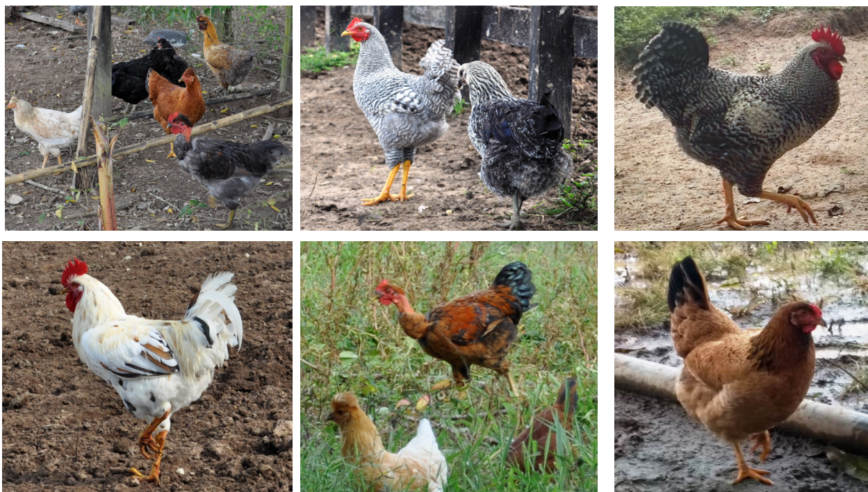
Figura 2. Biotipos criollos de Gallus gallus domesticus (Phasianidae), Subregión sabana, departamento de Sucre Colombia.