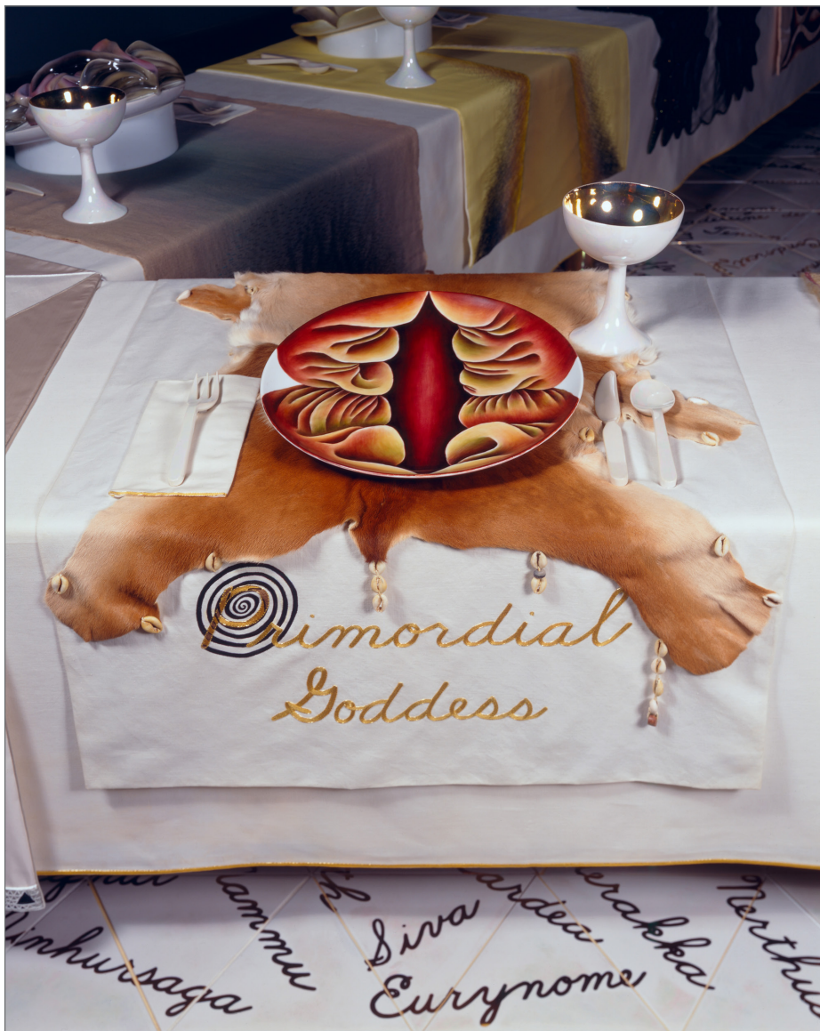
2. Primordial Goddess Place Setting in The Dinner Party . Judy Chicago. 1974–1979.

Remitiéndonos de nuevo al ejemplo de Judy Chicago, contamos con la obra The Dinner Party , en la que recuerda a aquellas mujeres cuyos logros han quedado silenciados por su condición de género y que a modo de invitación, realiza una reunión de todas ellas, criticando el anonimato al que se les ha