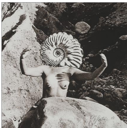
1 Goddess Head, Mary Beth Edelson. 1975

Al mismo modo que la divinidad relaciona el cuerpo femenino con un espacio natural, presenta una oportunidad de representar el cuerpo de la mujer en su totalidad, o sus genitales de un modo más específico y explícito, más allá de las censuras que han impedido su visibilidad en los diferentes periodos históricos.