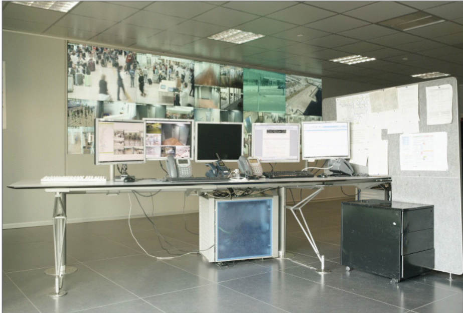
Fig. 1, 2 y 3. Paula Artés, L.2/86. 2016. Fotografía.

En este caso, las respuestas son tanto afirmativas como negativas, y ahí se demuestra este posicionamiento de indefinición. La artista había contado finalmente con la colaboración y apoyo de la Guardia Civil ya que el valor propagandístico de estas fotografías también atestiguan la función que cumplen dichos trabajadores minusvalorados por su invisibilidad. Si la crítica parece ser dignificadora, más bien es todo lo contrario.