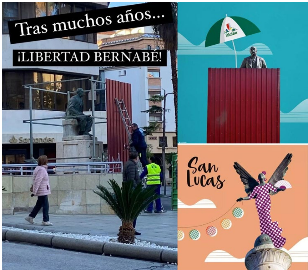
Imagen 4. Collage con pequeña selección de memes e ilustraciones con monumentos de Jaén (Fuente: Instagram de El Crea).