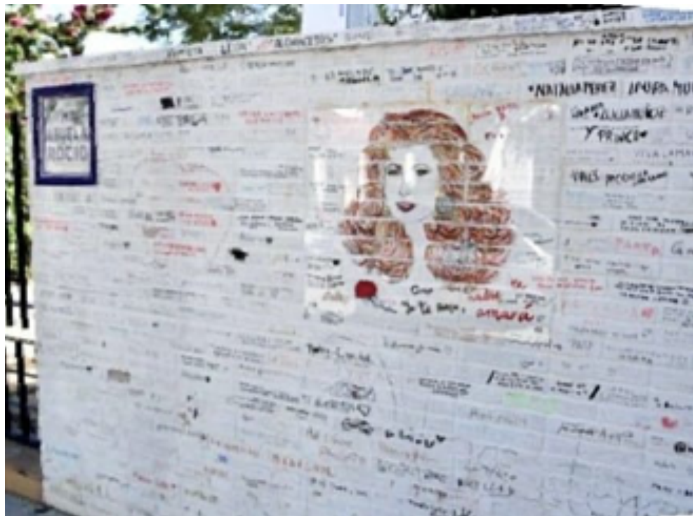
Imagen 3. Antigua casa de Rocío Jurado (Fuente: imagen propia).

en una parada obligada para los turistas que visitan la localidad, quedando la casa integrada en la ruta que en 2020 inauguró el Ayuntamiento para visitar los lugares más emblemáticos ligados a la celebridad.