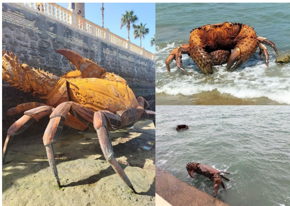
Imagen 2. «Cangrejos en el litoral». Fotografías, septiembre 2024 (Fuente: imágenes propias).

Sin embargo, se le hará un molde en bronce que sí será el monumento final que quede en la plaza, pero ese molde reflejará las mordidas que la sal, las algas, los escaramujos han hecho en el hierro virgen, puesto que el material empleado es hierro reciclado, pero desprendido de pintura, galvanizados y otros elementos para que no fuera contaminante y además para que los elementos orgánicos se adhirieran a él dejando sus raíces. Los elementos reciclados sirven de memoria, pues son elementos de la propia localidad que han estado llenos de vida 7 .