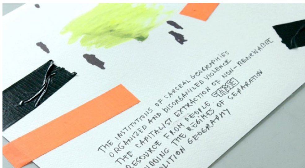
Fig. 3. Fotograma del video documental experimental “Insurgent Flows. Trans*Decolonial and Black Marxist Futures”, Marina Gržinić y Tjaša Kancler, 2023. Dibujos performativos de Siniša Ilić.

estimular el deseo y rehacer las condiciones físicas, políticas y afectivas de nuestra vida cotidiana, forman, moldean y controlan las subjetividades. Mbembe (2013) define esta institución tecno-fenomenológica como «capitalismo de la imagen». Barriendos (2010) habla de «la colonialidad del ver» como constitutiva de la modernidad que en consecuencia actúa como un patrón heterárquico de dominación, determinante para todas las instancias de la vida contemporánea. Investigando la financiarización de la vida diaria y la colonización de la semiótica, Beller (2021, 10) sitúa «el desarrollo de innumerables sistemas para cuantificar el valor de las personas, los objetos y los afectos como endémico del capitalismo racial y la computación. Por lo tanto, la computación debe reconocerse no como un mero surgimiento técnico, sino como el resultado práctico de una lucha continua y sangrienta entre los que-quieren-tenerlo-todo y lxs que-serán-desposeídxs».