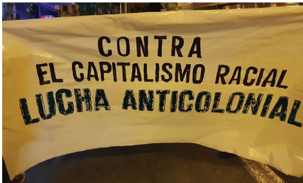
Fig. 2. La pancarta del colectivo t.i.c.t.a.c. en la manifestación nocturna transfeminista “La nit es nostra”, 7M 2019, Barcelona.

muchas otras iniciativas contra los innumerables actos de violencia racista, clasista, cisheteropatriarcal y capacitista. Como escribe Ahmed (2004, 189), «La solidaridad no asume que nuestras luchas son las mismas luchas, o que nuestro dolor es el mismo dolor, o que nuestra esperanza es por el mismo futuro. La solidaridad implica compromiso y trabajo, así como el reconocimiento de que, incluso si no tenemos los mismos sentimientos, o las mismas vidas, o los mismos cuerpos, vivimos en un territorio común». A través de este esfuerzo colectivo continuamos enfrentando las estructuras sistémicas que nos afectan de maneras diferenciadas e interseccionales, arraigadxs en el compromiso con las luchas por la descolonización: política, social, económica, cultural, corporal, visual y epistemológica.