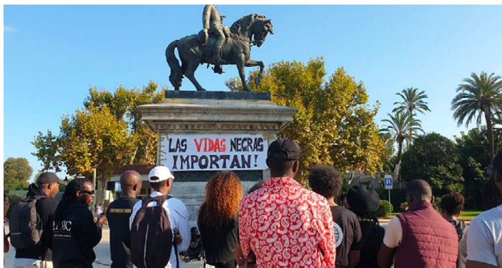
Fig. 1. #ResACelebrar #MoltAReparar! La manifestación organizada por CNAACAT-Comunidad Negra Africana y Afrodescendiente en Catalunya, 12 de octubre de 2022, Barcelona.

A lo largo de estos años de grandes movilizaciones políticas a nivel internacional; los movimientos Indígenas, Black Lives Matter, los movimientos transfeministas, estudiantiles y anticoloniales, Free Palestine... se publicaron numerosos libros, revistas, fanzines, se desarrollaron proyectos artísticos y expositivos, se organizaron conferencias, talleres, escuelas de verano, encuentros activistas y acciones. En Europa del Este que ha sido convertida en una zona frontera/guerra de la UE, nuestro contexto está en debate en relación a las políticas de memoria, el comunismo, el movimiento de países no-alineados, los feminismos y movimientos LGBTQI+, el postsocialismo / turbocapitalismo, las fronteras, la racialización, y las guerras. Estas reflexiones abarcan los duraderos legados coloniales/imperiales, sus patrones repetitivos presentes también durante la época socialista, y continuidades que actualmente forman las estructuras políticas, económicas y sociales en esta región.