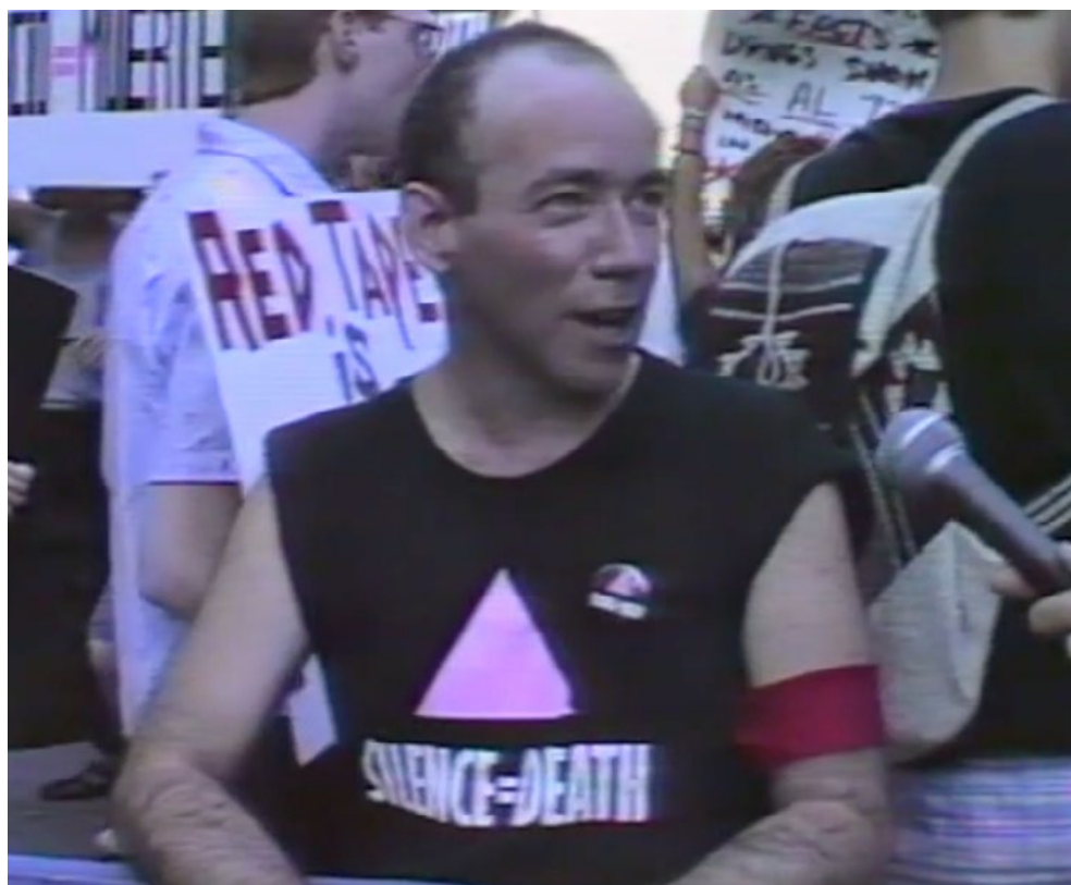
Figura 3. «Testing the limits NYC», video, Testing the Limits collective (1987). Fotograma extraído del documental.

El mismo grupo dio un paso más y se puso a trabajar en otro audiovisual, este de carácter más específico relacionado con ACT UP (AIDS Coalition to Unleash Power). « Voices from de front » es el título que recibió esta segunda obra que sirvió para atestiguar la posibilidad del cambio a partir del activismo (Hutt, Elgear & Meieran 1991). Este se puede considerar como el primer largometraje documental sobre el activismo del sida en Estados Unidos y en él se exponen las repercusiones emocionales y políticas del activismo comunitario mediante los testimonios de los protagonistas directos. Esta obra es una potente colección de imágenes y palabras, de eventos organizados para transformar la conciencia colectiva, revelar las deficiencias del sistema sanitario y desafiar la inacción y negligencia gubernamental frente al sida. Además de los sucesos mencionados, el documental captura la esencia de la desesperación y la premura que experimentaban los activistas. « Voices from de front » es un trabajo fundamental que inmortaliza un momento histórico en la lucha contra el SIDA, sirviendo como un recordatorio del poder del activismo comunitario.