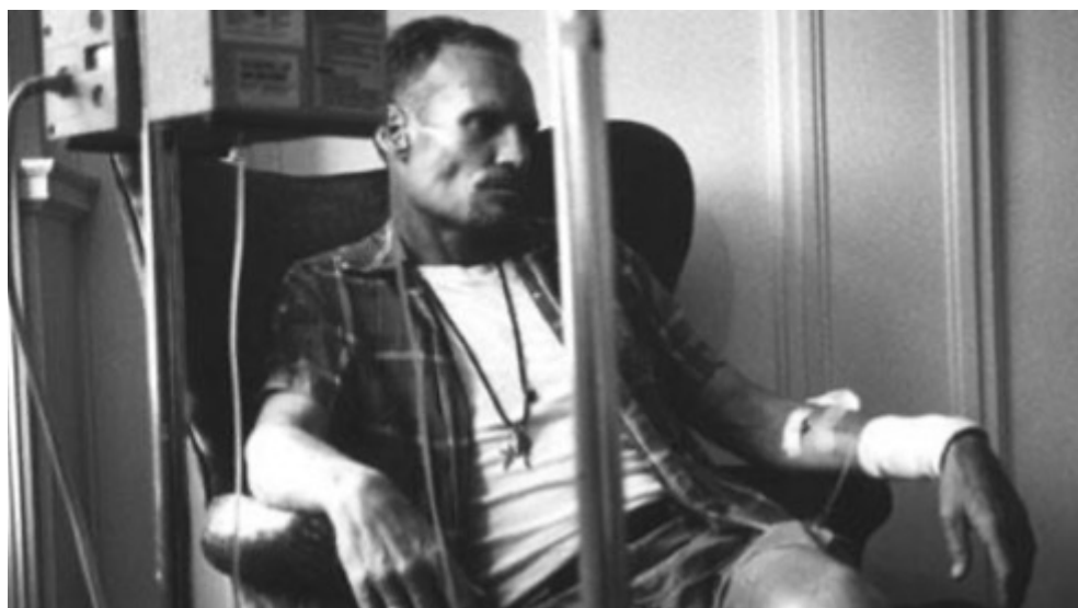
Figura 1. «One foot on a banana peel, the other foot on the grave ( Secrets from the Dolly Madison room )». Juan Botas (1994). Fotograma extraído del documental.

Esta utilización del audiovisual como táctica para la memoria se puede observar en la obra videográfica de artistas como Pepe Miralles y Javier Codesal. En la producción de ambos creadores, el vídeo se convierte en un instrumento para capturar y transmitir los aspectos indescriptibles de la crisis del sida, partiendo de relatos personales que, al volverse públicos, se transforman en símbolos del sufrimiento y testimonios que ayudan a preservar la memoria. El recuerdo también funciona como una táctica de empoderamiento, ya que, sin un entendimiento claro del pasado, es complicado enfrentar un futuro.