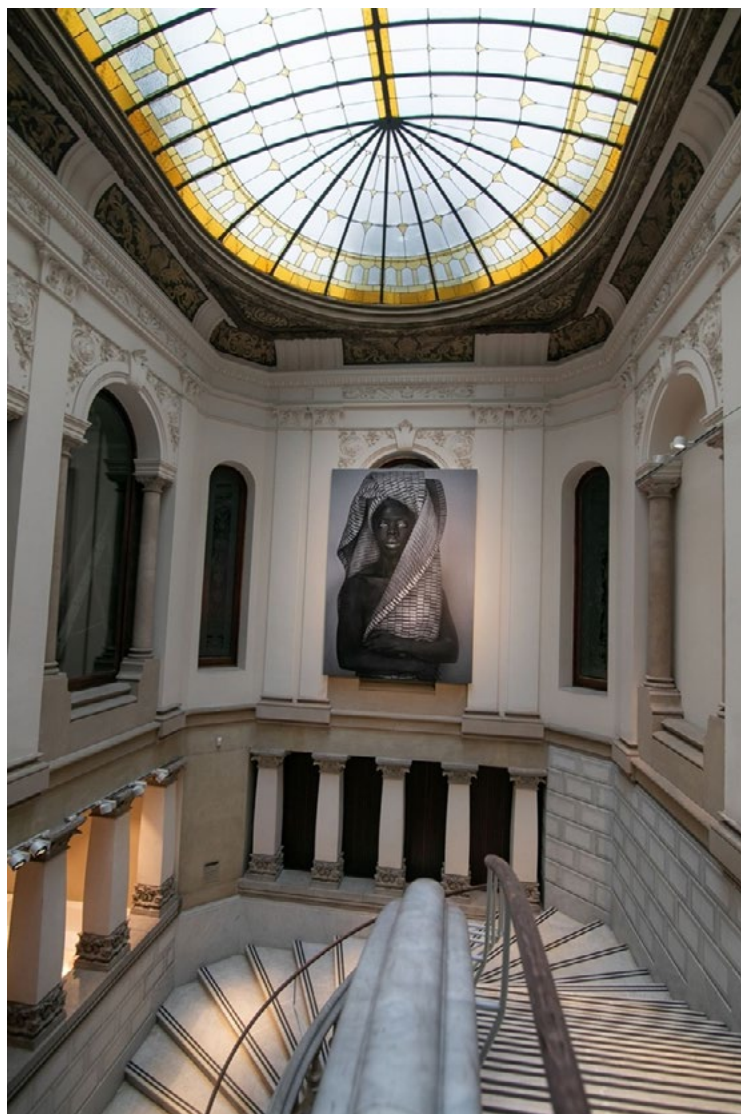
Fig. 1. Zanele Muholi. «Lena, London», 2018. Fotografía mural, 300 x 211 cm. Escalera del Museo de Arte Prohibido.

haber sido previamente objeto de señalamiento, censura o vilipendio en algún momento de su historia o en el contexto de su exposición. A través de este análisis, el objetivo es comprender los mecanismos de censura que se emplean contra el arte crítico en las prácticas corporales señaladas, así como las estrategias de resistencia que utilizan los artistas, museos y espacios públicos para seguir expresándose y generando conciencia.