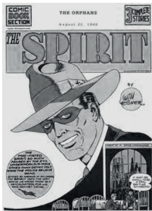
Figura 1 – Capa de 1940