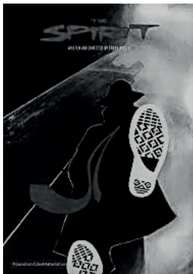
Figura 4 – Imagem do filme The Spirit (2008)