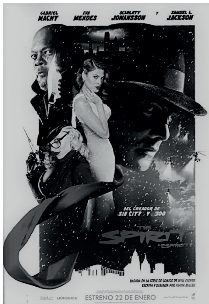
Figura 7 – Cartaz do filme de Miller (2008)