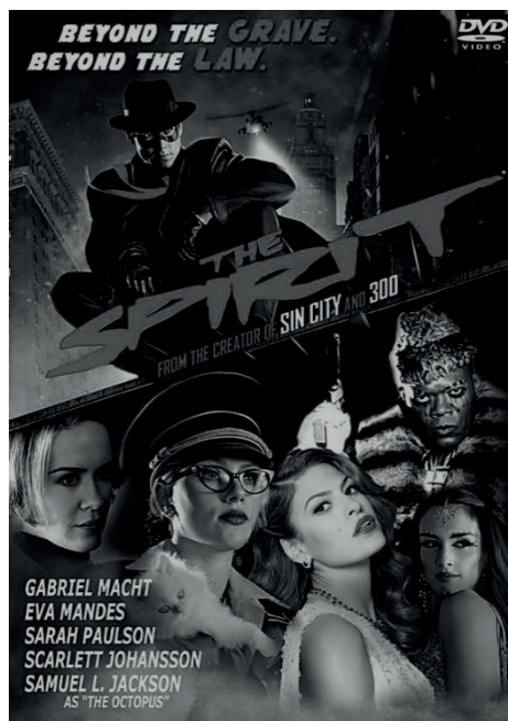
Figura 10 – Eisner estilizado por Miller (2008)