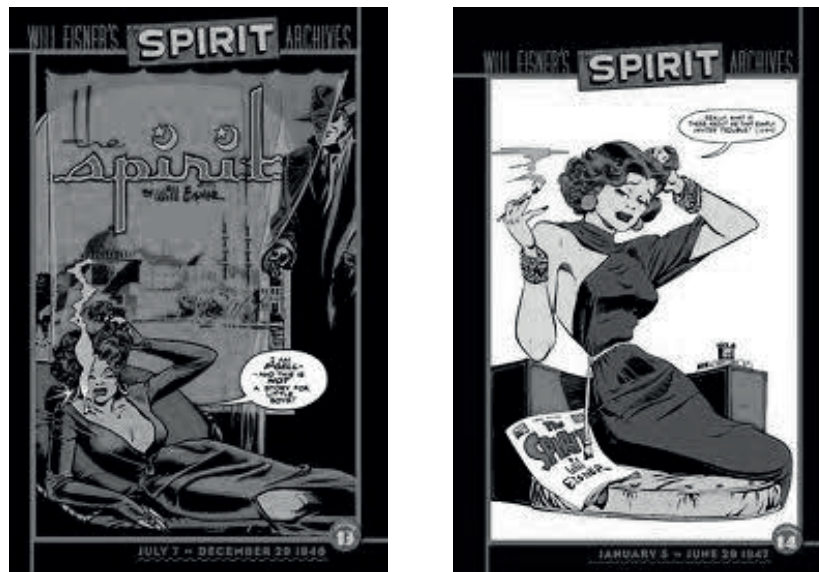
Figuras 5 e 6 – Capa V. 13 (1946) e Capa V. 14 (1947)