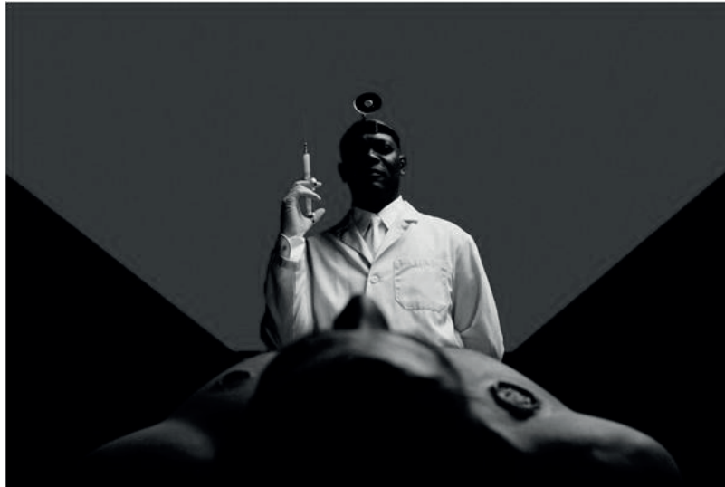
Figura 11 – Frame de The Spirit (2008)