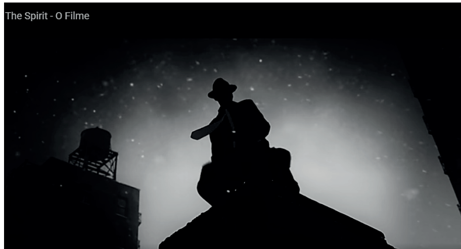
Figura 8 – Frame do filme The Spirit (2008)