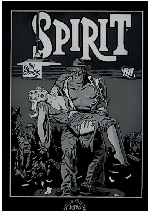
Figura 9 – O estilo gráfico de Eisner (1940)