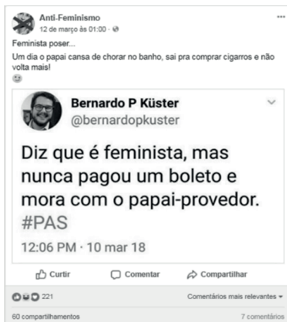
Figura 3 – Publicação da página “Anti-Feminismo” que desmerece as feministas como irresponsáveis e dependentes dos homens