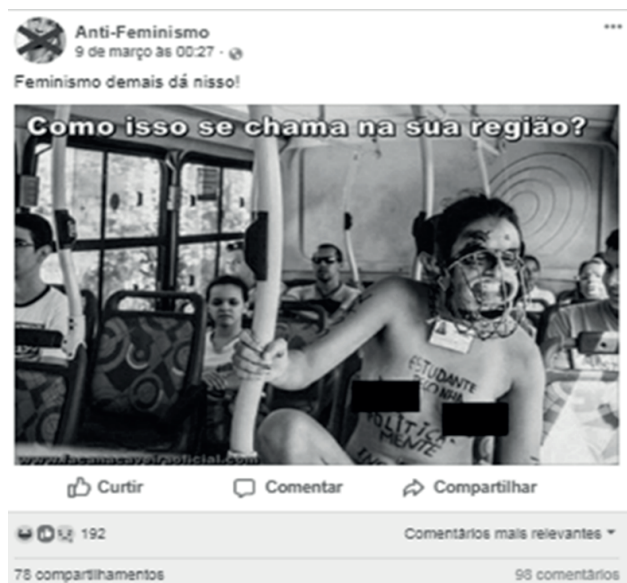
Figura 2 – Publicação da página “Anti-Feminismo” que mostra uma militante protestando seminua