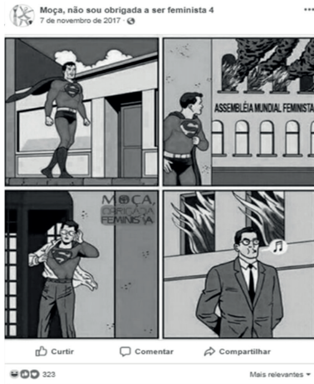
Figura 6 –Publicação da página “Moça, não sou obrigada a ser feminista” que fantasia sobre a morte de feministas

Ainda que aleguem que o feminismo “está condenado ao fracasso”, na legenda, advertem “o importante é estar sempre atento”. E o que será feito destas mulheres “perigosas”, que “se aproveitam de pessoas iludidas” e propagam “ideias obscuras”? A publicação a seguir (Figura 6) apresenta uma ideia.