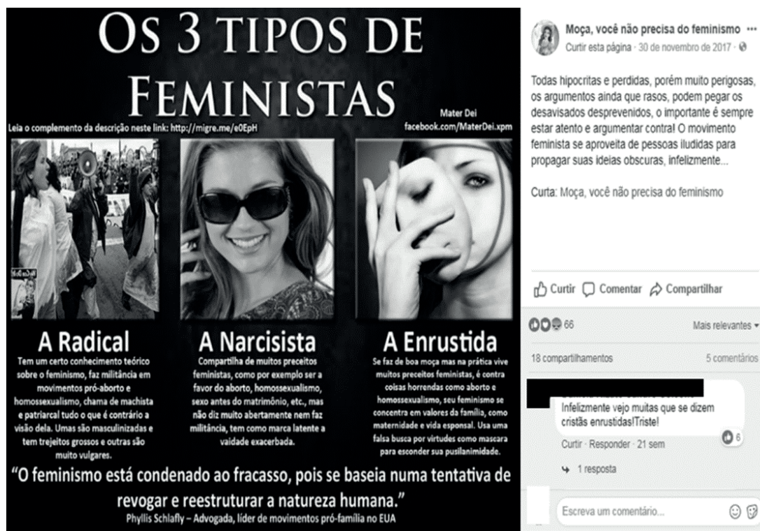
Figura 5 – Publicação da página “Moça, você não precisa do feminismo” que apresenta 3 tipos de feministas