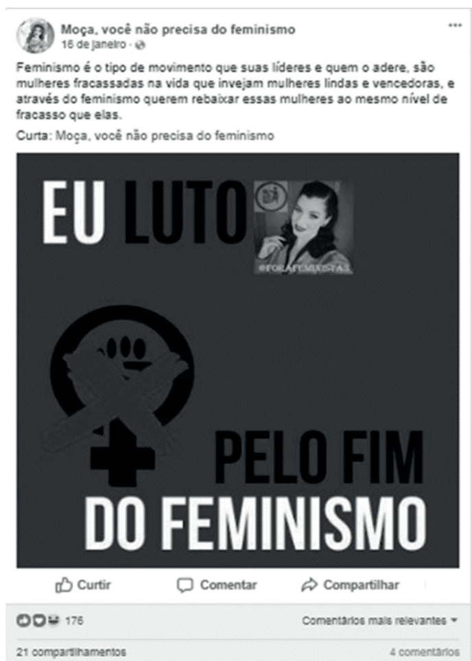
Figura 4 – Publicação da página “Moça, você não precisa do feminismo” que identifica as feministas como fracassadas e invejosas