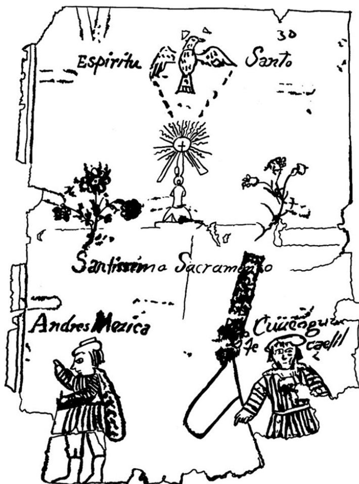
Figura 2. “Colección de Documentos y Títulos de Tierras (S.R.A Títulos Primordiales)”, AGN, Caja No. 1, Exp. 5, Núm. de Clasificación 276.1/238, fo.30r. Dibujo de Alberto Hernández Vásquez.

su labor evangelizadora en Europa. 36 En relación con lo anterior, no debemos pasar por alto que la praxis teológico-pastoral de los primeros evangelizadores se basó en el reconocimiento puntual de la Biblia como referente para desplegar las estrategias de conversión y recuperación de los gentiles para las filas del