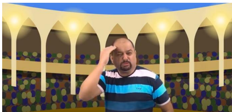
Figura 1 – A Piada do Touro em Libras na plataforma Youtube no canal Na Palma da Mão .