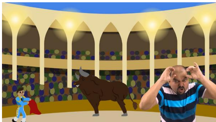
Figura 6 – Segundo touro