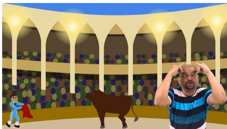
Figura 7 – O terceiro Touro